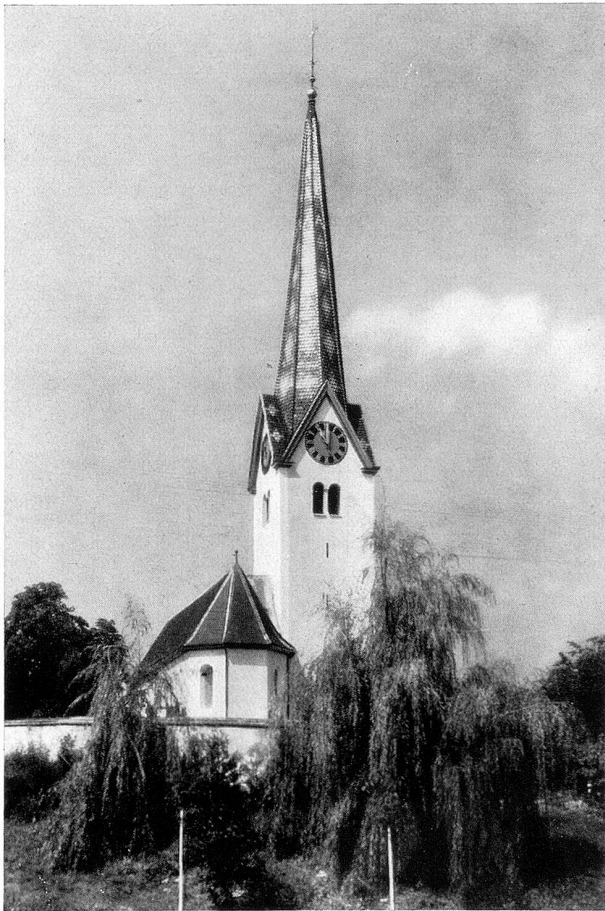
Die Kirche in Affeltrangen nach der Renovation

Nach dem Mittagessen, das ich hastig einnahm, begab ich mich wieder auf den Bahnhof. Von allen Seiten strömten die Leute herbei, um die neuen Rufer und Mahner zu sehen und zu betasten und ihnen einen würdigen Empfang zu bereiten. Auch die Musikanten rückten in ihren grünen Uniformen und mit den Instrumenten auf. Endlich schritten einige Fuhrmänner mit achtzehn stattlichen Pferden daher. Die Geschirre waren sauber geputzt und die Sonne spiegelte sich im Messingzeug. Vor dem Wagen mit der größten Glocke wurden sechs Pferde gespannt und vor die andern je vier. Die Musik stand in Reih' und Glied bereit, der Dirigent komman-