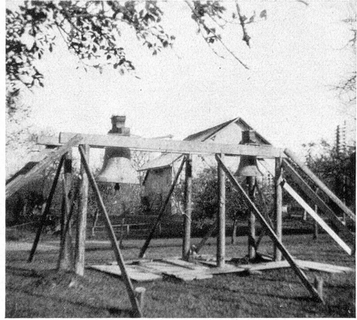
Die beiden kleinen alten Glocken auf ihrem Holzgerüst

Voll Sehnsucht erwartete das ganze Dorf den 8. Dezember 1934, den Tag des Glockeneinzuges. Als ich um halb 11 Uhr jenes denkwürdigen Tages auf den Bahnhof kam, umringten schon viele Leute den Eisenbahnwagen, auf dem unsere vier neuen Glocken standen. Ich war ganz erstaunt über die Größe und Schönheit des Geläutes, welches das Weihnachtsgeschenk des ganzen Dorfes werden sollte. Auch die Sonne, die endlich den dicken Nebel durchdringen konnte, wollte sehen, wie die schweren