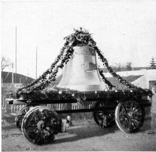
Die größte Glocke „h“

dierte: «Vorwärts marsch!» und mit den ersten Tönen eines Marsches zogen die Pferde kräftig an. Jung und alt begleiteten die Glocken mit frohen Gesichtern durch die zur Kirchgemeinde gehörenden Ortschaften Tobel, Zezikon und Affeltrangen. Unterdessen verdichtete sich der Nebel wieder; der ganze Umzug wurde von ihm eingehüllt und um 4 Uhr hatten unsere neuen Glocken die ehrwürdige Einzugsfahrt vollendet. Bei nassem und kaltem Nebel begrüßte Herr Kantonsrat Rieser das Geläute und hieß es im Namen des ganzen Dorfes herzlich willkommen.