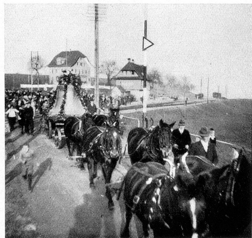
Der Einzug der Glocken

Einen besonders feinen Anblick bietet der Chor, der völlig umgebaut werden mußte. Die Kirche diente früher beiden Konfessionen und im Chor stand der Altar der Katholiken, der nun herausgenommen worden ist. So galt es den freigewordenen Raum neu zu gestalten und dem Innern einzugliedern. Sein Farbton ist nun dunkler gehalten als derjenige des Schiffes. Die kräftigbraune Täfelung reicht hier bis zu den Fenstern. Einfache Stühle umgeben den eckigen Raum. In der Mitte steht der Taufstein. Links und rechts von ihm befindet sich eine zweite Reihe Chorstühle, deren Abschluß das Harmonium bildet.