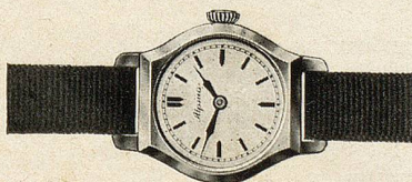
Gold 14 Kt. . . . . Fr. 137.—