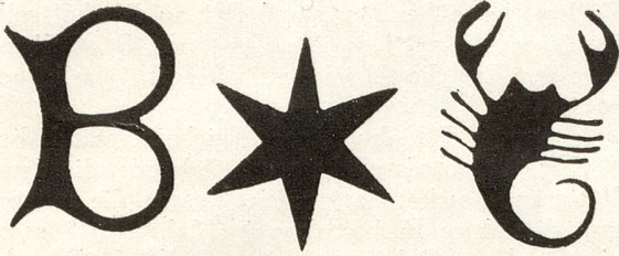
Die bischofszellischen Leinwandzeichen: B, Stern und Skorpion.

unerkannt im hiesigen Bürgerarchiv gelegen, bilden heute einen Bestandteil unseres neugegründeten Ortsmuseums und legen Zeugnis ab von einstiger blühender Industrie.