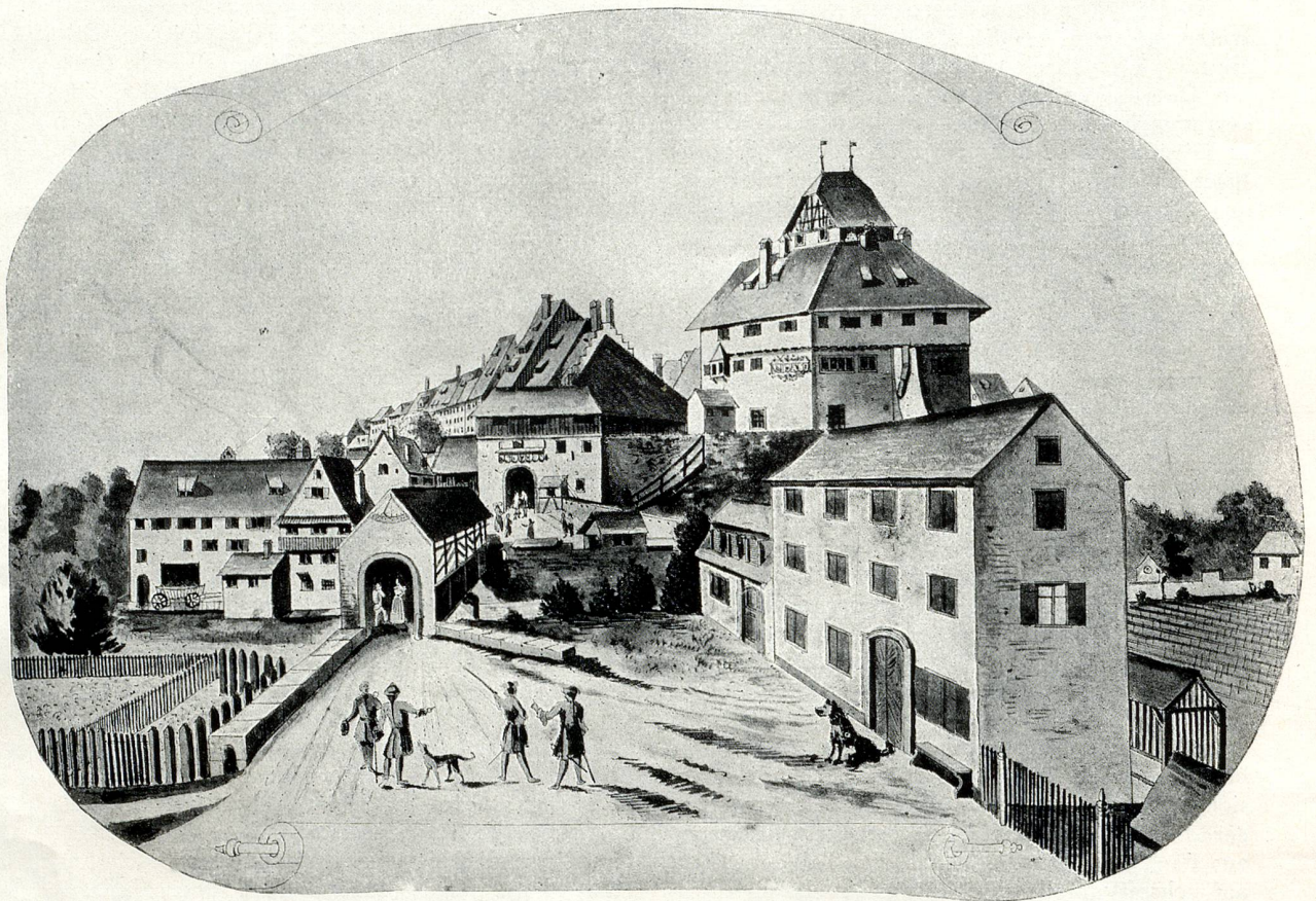
Das Niederdorf mit dem Schloss, links der Gasthof zum „Löwen“, rechts die Bleichereigebäude, nach einer Zeichnung von A. Lenz, 1771

archiv. Standen die Bürger anfangs unter dem Vogt, so durften sie sich nach der Ordnung von 1425 einen kleinen und grossen Rat wählen, der unter der Leitung eines Schultheissen die Geschäfte der Stadt selbständig leitete, sogar den Blutbann ausübte. Unter der österreichischen Hoheit kämpften Frauenfelder Mannschaften an der Seite ihrer Herren wohl schon bei Morgarten, sicher bei Sempach und Näfels gegen die Schweizer; im Appenzellerkrieg (1407) und im alten Zürichkrieg (1446) hatte die Stadt als Sitz einer österreichischen Mannschaft Belagerungen oder Besetzungen auszuhalten, ohne indessen besonderen Schaden zu nehmen. Die Bevölkerung bestand einerseits aus ritterlichen Dienstleuten der nähern Umgebung, z. B. den Herren von Strass, Blumenstein, Gachnang, Wellenberg, Spiegelberg u. a., die sich ein Steinhaus an der Stadtmauer bauten und zeitweise dort wohnten, ohne ihre Burgen ganz aufzugeben. Sie waren als Ritter gewiss geschätzte Bürger, zur Führung der militärischen Siedelung wohl geeignet. Andererseits werden Landleute aus der näheren und weiteren Umgebung, zum guten Teil bisher Leibeigene, die Stadt zum Wohnort gewählt haben, in der Hoffnung, dadurch der Freiheiten teilhaftig zu werden, die einem wehrhaften