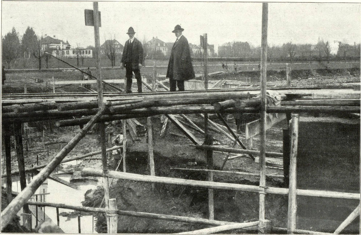
Hafen im Bau begriffen.