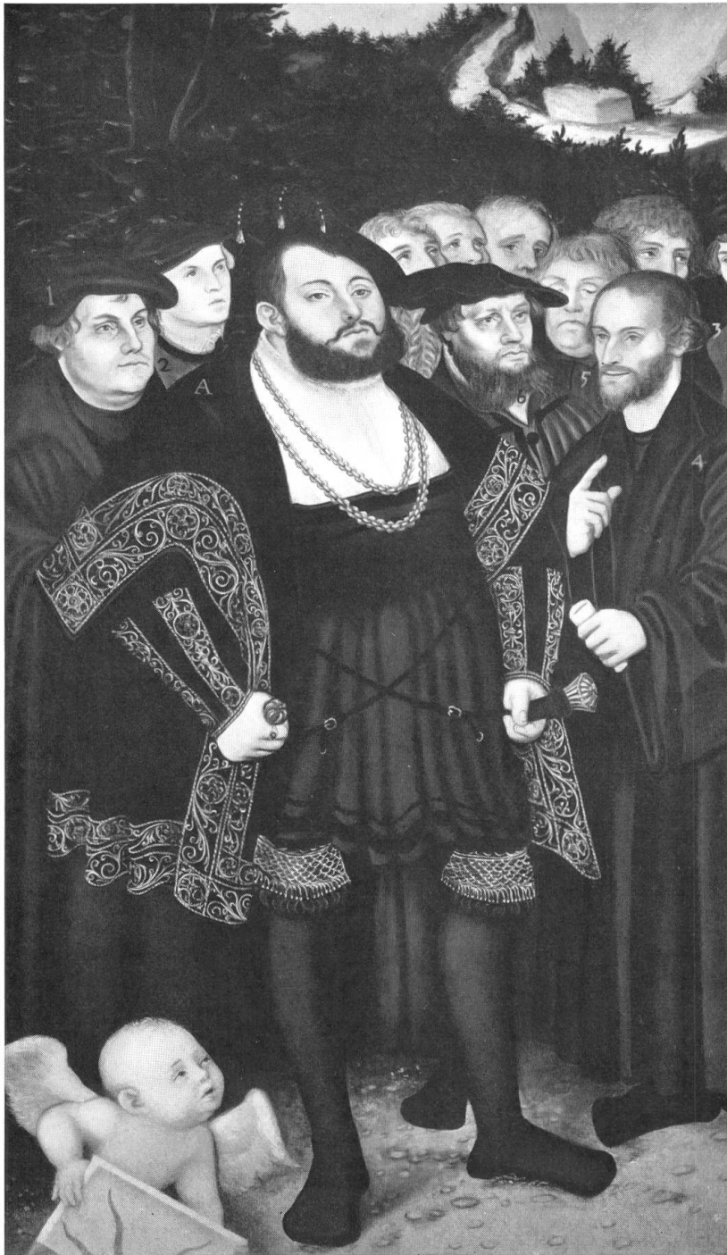
Bild 1. Martin Luther und seine Freunde. Gemälde von Lucas Cranach d. Ä. Reproduziert mit freundlicher Genehmigung des Besitzers, des Toledo Museum of Art, Toledo 2, Ohio, USA.