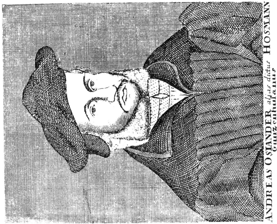
Bild 3. Andreas Osiander. Stich unbekannter Herkunft.