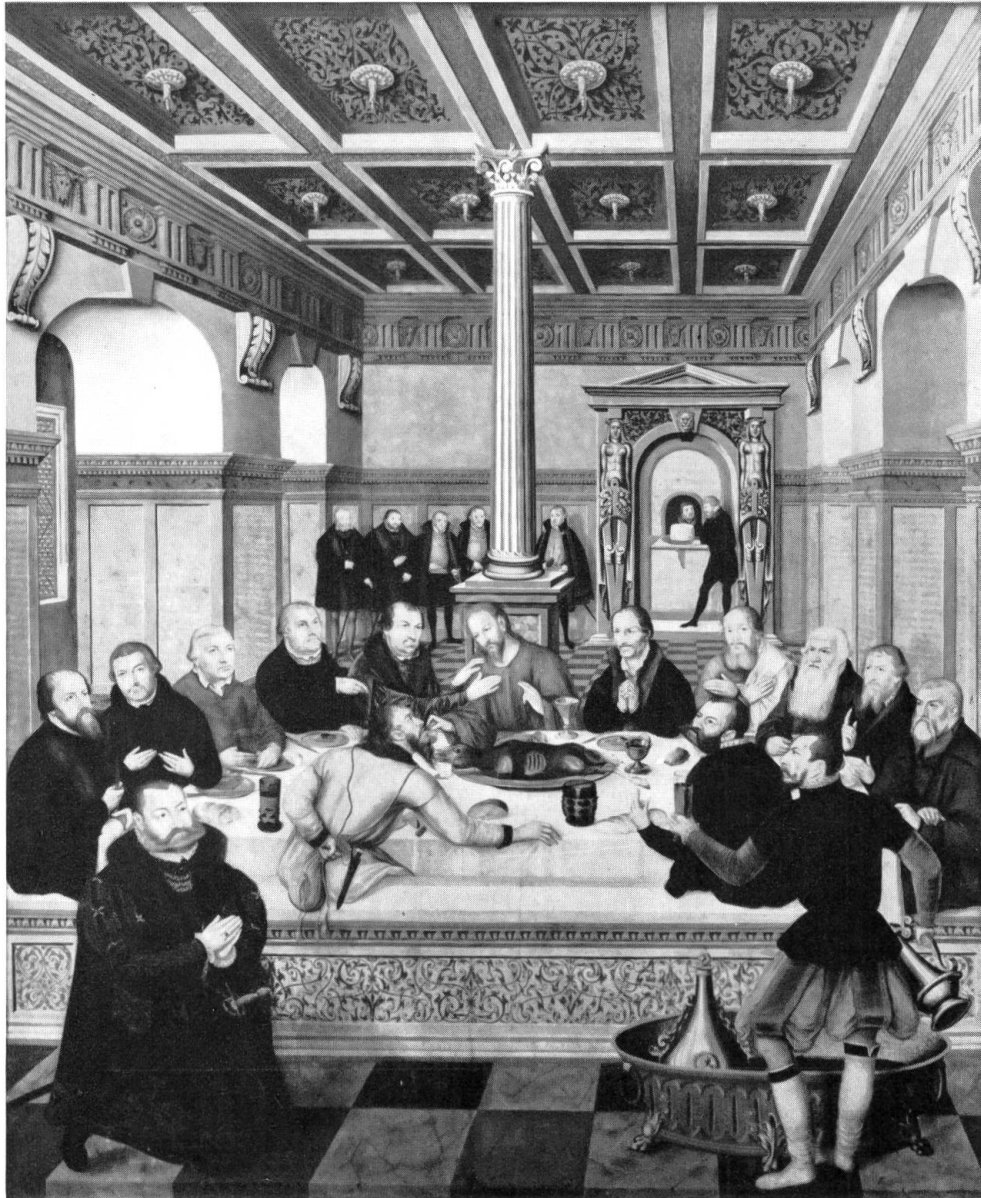
Bild 5. Das Dessauer Altarbild: das Abendmahl mit den Reformatoren als Jüngern Christi. Gemälde von Lucas Cranach d. J., 1565 vollendet.