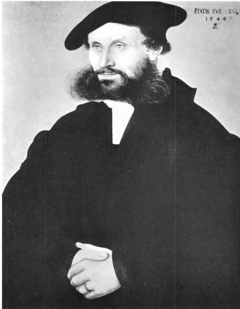
Bild 4. Andreas Osiander. Gemälde von Lucas Cranach d. J., 1544, gewöhnlich bezeichnet als «Männliches Bildnis» oder als «Bildnis eines fünfzigjährigen Mannes». Eigentümer die Dresdner Gemäldegalerie. Abbildung mit freundlicher Genehmigung der Generaldirektion der Staatlichen Kunstsammlungen Dresden.