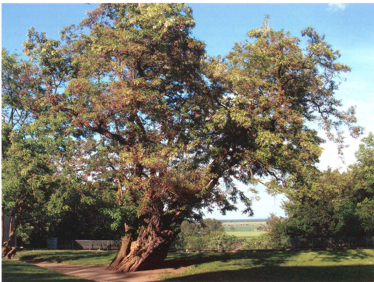
Abb. 6: Neophyten als Zeugnis von Geschichte. Mehrere Hundert Jahre alte Robinie am Schloss Strehla/D, 2008.

Die Beurteilung gebietsfremder Arten erfordert stets eine normative, auf individuellen oder gemeinschaftlichen Wertmassstäben beruhende Bewertung. Der Naturschutz bewegt sich derzeit zwischen zwei gegensätzlichen Positionen. Wenn beide Ansätze, einerseits die Bewahrung der Reste der ursprünglichen Naturlandschaft und der traditionellen vorindustriellen Kulturlandschaft, andererseits die Erweiterung des Spielraums für natürliche Prozesse, integriert werden, können Anpassungsprozesse von Ökosystemen an sich wandelnde Landnutzungen