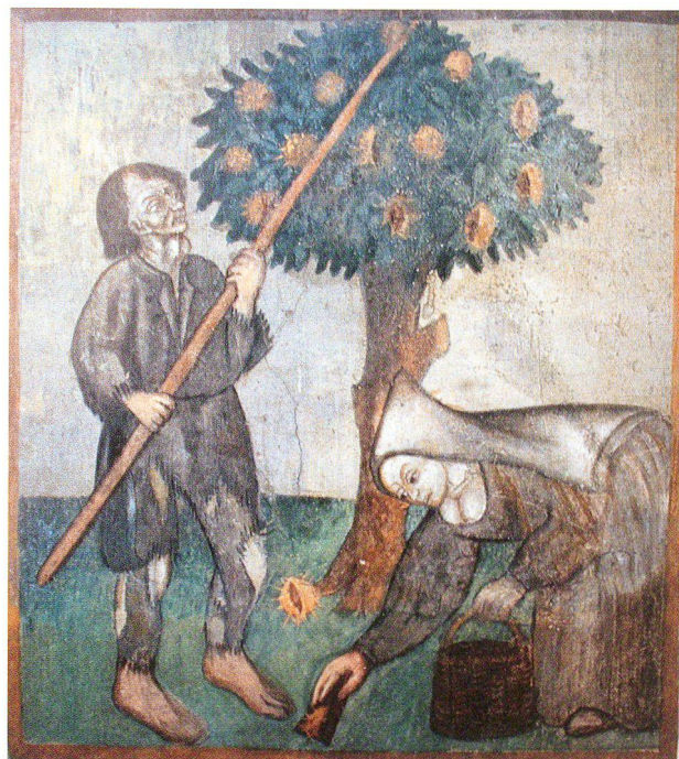
Abb. 1: Kastanienlese im Spätmittelalter, Oktobermonatsbild in der Kirche Santa Maria del Castello/Mesocco, Mitte 15. Jahrhundert.

Seit dem Aufkommen von Gartenbau und Landwirtschaft vor 7'000 Jahren gelangten unter dem Einfluss des Menschen durch Handel und Verkehr, Völkerwanderungen und Kriege gebietsfremde Pflanzenarten nach Mitteleuropa. Bis zum Jahre 1492 wurden viele Arten aus