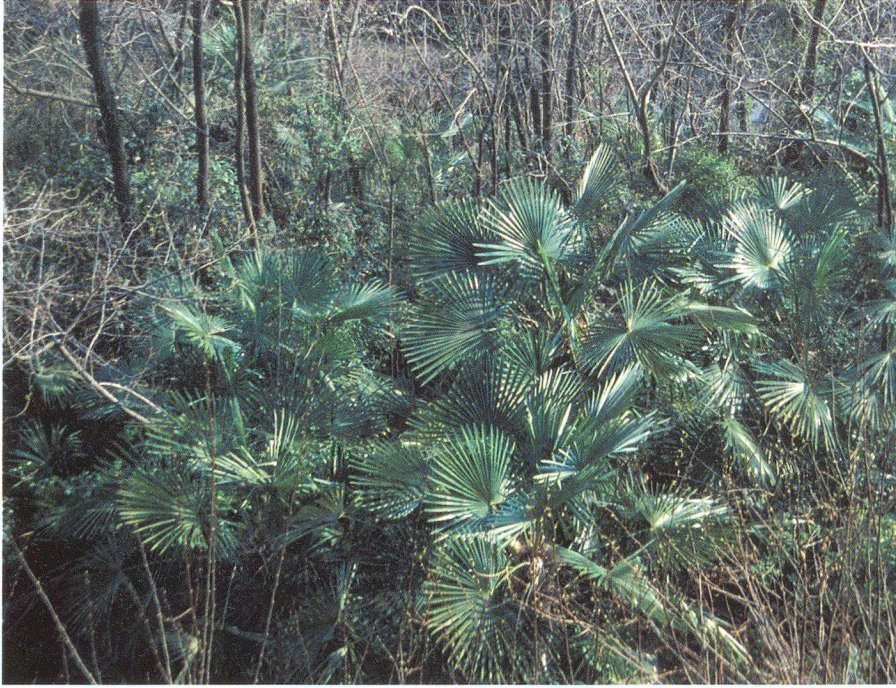
Abb. 5: «Exoten» erobern siedlungsnahе Wälder. Palmenpopulation bei Madonna dal Sasso/ Locarno, um 2002.