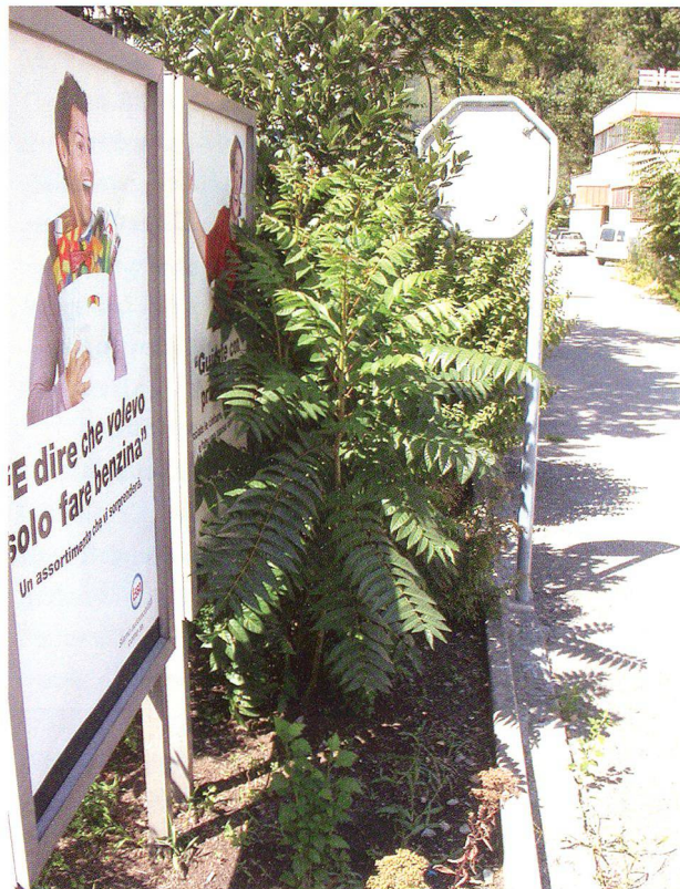
Abb. 2: Der Götterbaum als Brachenbesiedler, 2004.

Nur wenigen Neobiota gelingt die Unterwanderung naturnaher und der Aufbau neuartiger Pflanzengesellschaften. 18 Die meisten etablieren sich in ökologischen Nischen, die von der einheimischen Flora unbesetzt bleiben, und können so innerhalb der Ökosysteme auch wichtige Ersatzfunktionen wahrnehmen. 19 Untersuchun-