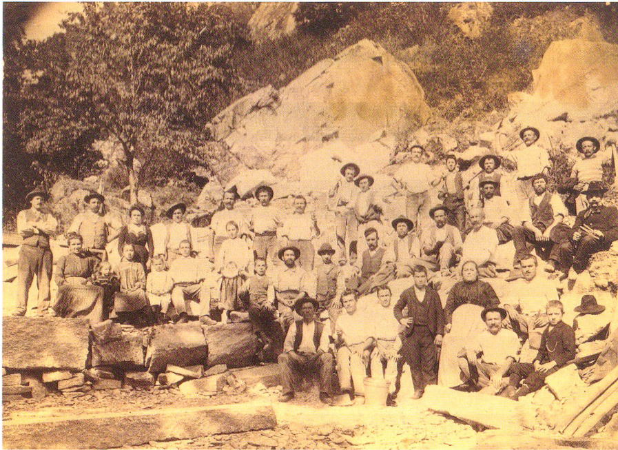
Abb. 3: Belegschaft mit Angehörigen in einem Steinbruch bei Giornico, im Hintergrund vermutlich ein Götterbaum, um 1900.

Städte in Mode. Das Pioniergehölz mit breiter Standortamplitude erwies sich, wie die Robinie, widerstandsfähig gegen die Extrembedingungen in der Stadt. Seine vielseitigen Qualitäten, auch als Forst- und Landschaftsgehölz, verbreiteten ihn auf allen Kontinenten. 40