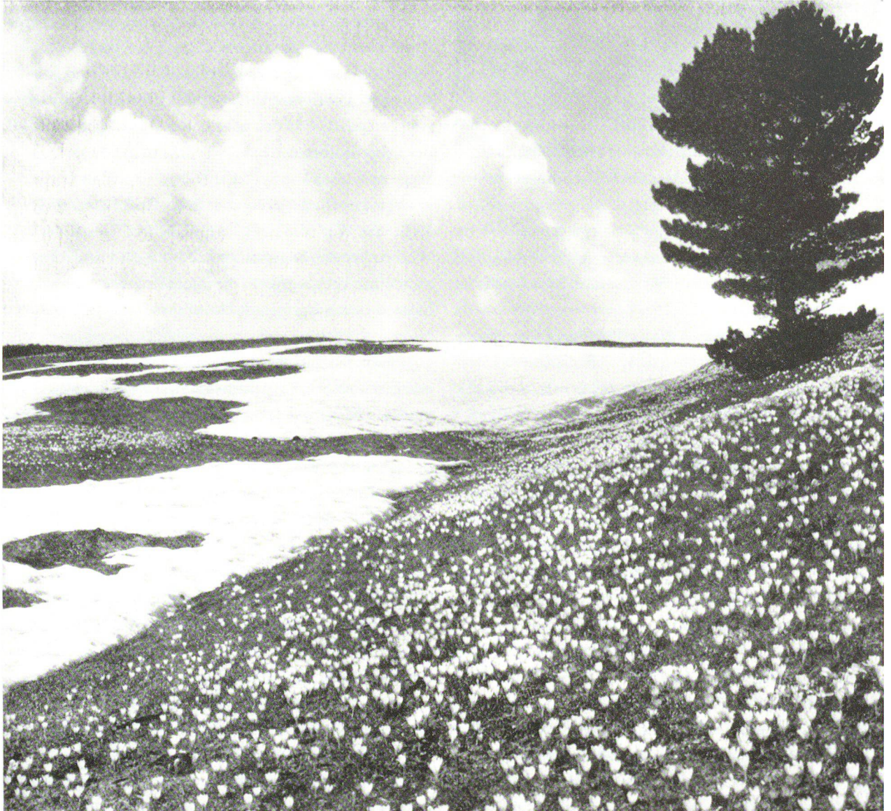
Abb. 2: Krokuswiese über St. Moritz in der gemeinsamen Publikation «Blumen auf Europas Zinnen» von Karl Foerster und Albert Steiner (Fotografien), 1937.

deren Gegenwart es geschah, auf eine niemals vergessliche Weise: jenen Bachlauf, der das oberste Gefilde durchfloss, – die Schneefirnen über dem Bergahornwald, in dem die Kuckucke lärmten, – das Abendjodeln auf der Hochwiese, – die Wasserfallschleier der Wiggisalp im Mondganz über den schön geschmiedeten Dachtraufen der Häuser, aus denen überall Musik kam – das blondgetäfelte