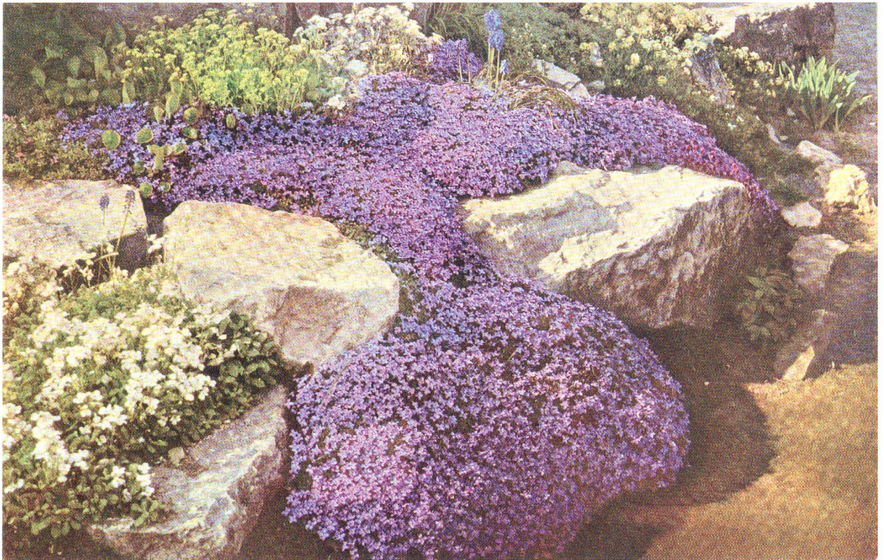
Abb. 3: Blühende Aubrieta im Bornimer Steingarten, publiziert in der Zeitschrift «Gartenschönheit» 1926.

die Steigerung durch schöpferischen Kampf frei.» 26 Daraus hoffte er, dass sich eine neue Art von Steingärten ergibt. Sie sollten den künstlerischen Kriterien genügen und einen Beitrag zu der von ihm geforderten «Wildnisgartenkunst» liefern. Nichts sollte an die überbordenden, dabei aber sehr unnatürlich wirkenden Felsformationen des späten Landschaftsgartens erinnern.