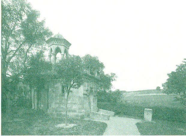
Heilig-Grab-Kapelle mit Blick zum Ölberg mit «Ölbaum», um 1900

hospital, das Pilgern, fremden Lehrern und armen Schülern offenstand. Doch über seine konkrete Unterstützung des Heiligen Grabes fehlt merkwürdigerweise jeglicher schriftliche Nachweis.