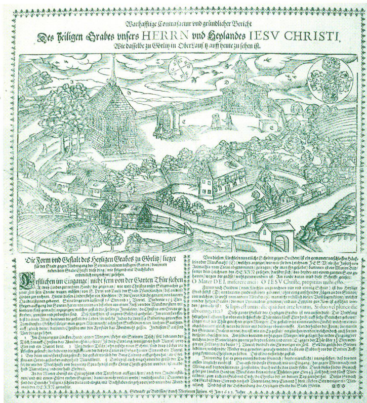
Vogelschau des Heiligen Grabes in Görlitz von Süden, 1623; Einblatt- druck mit anonymem Holzschnitt (Görlitz, Kulturhistorisches Museum)