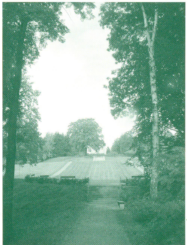
Blick vom Kidrontal auf Jüngerwiese und Ölberg mit «Ölbaum» und Krematorium

weislich mehrere Exemplare davon, sodass seine Kenntnis bereits zur Bauzeit um 1500 vorausgesetzt werden kann. Doch war es wohl nicht zuletzt die Sage von Emmerichs eigenen Reisebegleitern, die dazu geführt hat, dass die Görlitzer Grabkapelle schon früh als besonders genaues Abbild des Originals in Jerusalem galt, was zu einer überaus hohen Wertschätzung führte. Eindrücklich offenbart sich diese vor allem in dem Umstand, dass für vier weitere Nachbauten des Heiligen Grabes der Görlitzer Bau als Vorbild diente: in den schlesischen Orten Sagan (Żagań) und Neuland (Niwnice) bei Löwenberg (Lwówek Śląski), in der Warschauer Vorstadt Nowy Świat bei Ujazdów sowie im böhmischen Reichenberg (Liberec).