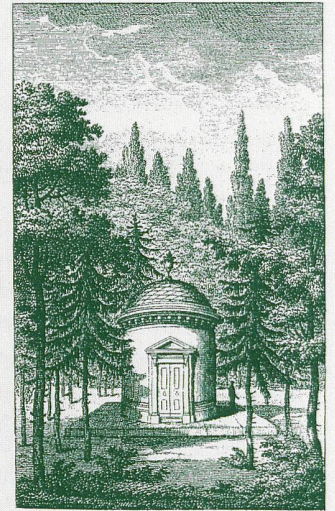
Der Flora Tempel