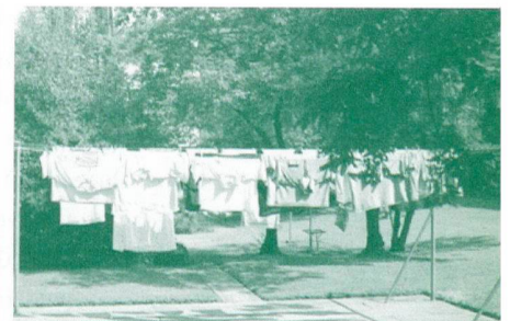
«Siedlungsbygiene in Schwamendingen 2»