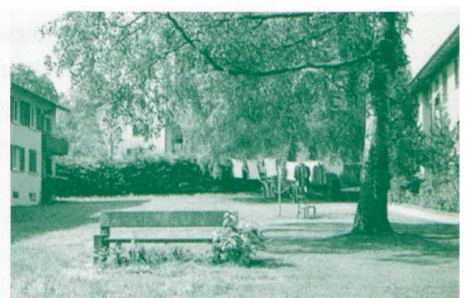
«Siedlungsbygiene in Schwamendingen 1»