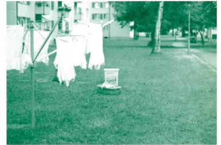
«Siedlungshygiene in Schwamendingen 3»

das Kriterium der «Bodenständigkeit» eine Rolle, welches Ammann als «verpflichtendes, undurchbrechbares Gesetz» 23 fordert. Er unterscheidet dabei zwischen der Pflanzenverwendung im geschlossenen Garten und derjenigen in der freien Landschaft. Während innerhalb des Gartens fremdländische Pflanzen durchaus sinnvoll seien, müsse in der Landschaft alles «Fremde», als Gegensatz zum «Einheimischen», möglichst vermieden werden. Dass sich die Pflanzenverwendung des ansonsten liberalen Ammanns hier den reaktionären Tendenzen seiner nationalsozialistischen Fachkollegen angleicht, überrascht kaum in einer Zeit der nationalen Glorifizierung auch in der Schweiz. Tatsächlich bezieht sich Ammann dabei nach eigener Aussage auf den deutschen Gartenarchitekten Alwin Seifert (1890-1972) und sein völkisch-konservatives Konzept der «bodenständigen Gartenkunst». Seiferts «Gartenkonzept will einen Zusammenhang zwischen Mensch, Boden und Landschaft bewahren bzw. wieder herstellen, um einer «Entwurzelung» des Menschen und damit dem Verlust des Heimatgefühls entgegenzuwirken», wie dies Charlotte Reitsam festgestellt hat 24 .