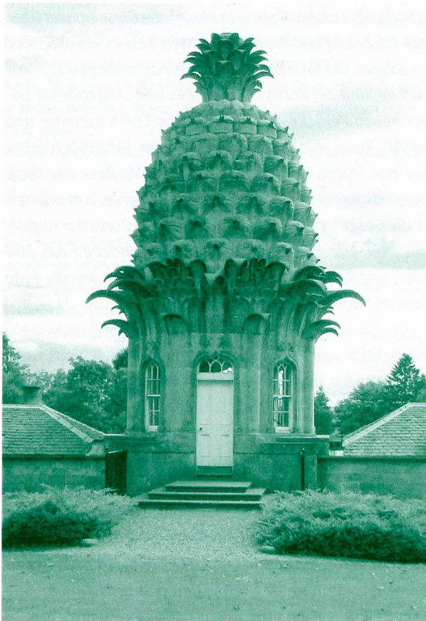
The Dunmore Pineapple, Schottland, 1761, heutiger Zustand.

Vom Londoner Hof aus eroberte die Ananas nach und nach auch den Norden der Insel. Wann genau die erste Frucht Perthshire erreicht hat, ist nicht zu eruieren; fest steht nur,