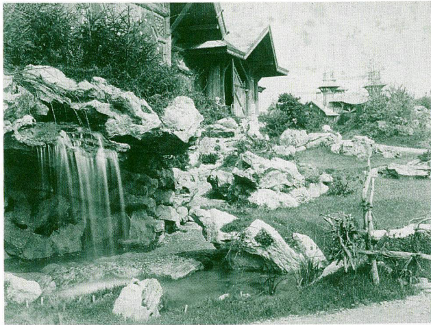
Alpengarten vor dem Pavillon des SAC, 2. Schweizerische Landesausstellung in Genf 1896

und Haustieren durch Auslese und Züchtung nach der Umsiedlung in klimatisch unterschiedliche Gebiete.