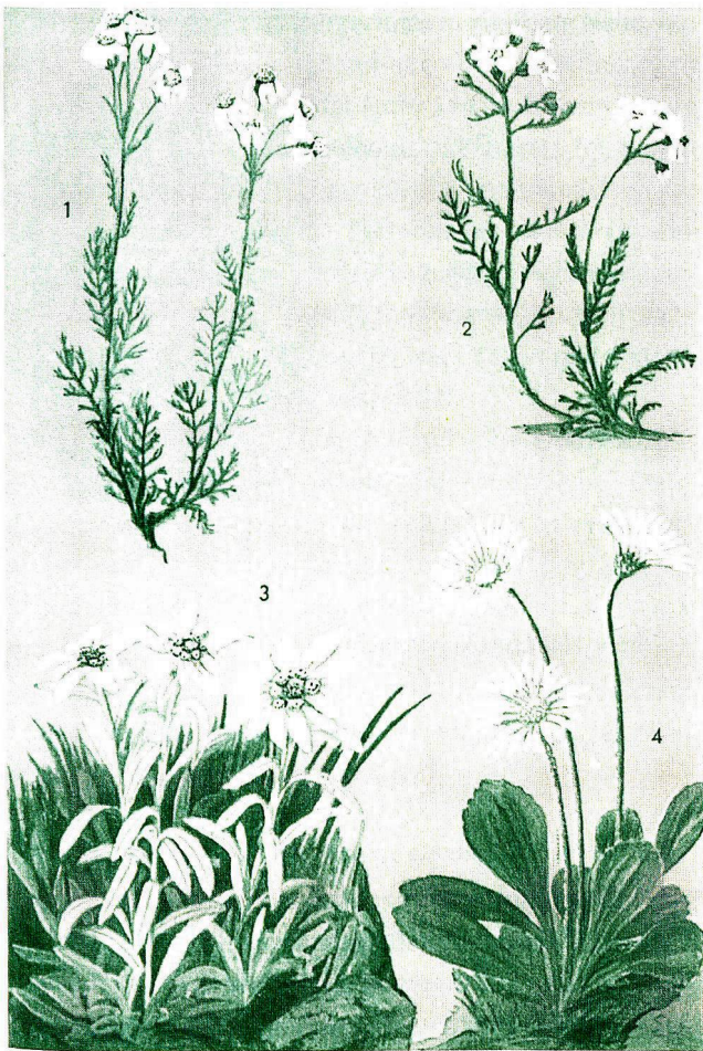
Alpine Pflanzen in botanischem Führer

und Tiere, Anzeichen aller Jahreszeiten auf kurzer Wegstrecke und besondere atmosphärische Erscheinungen wie das Alpenglühen. Die Aussicht, als neuer Blickmodus für Reisende, musste jedoch erst etabliert werden. Mit wachsender Übersicht über die Erdoberfläche wurden die traditionellen einzelnen Elemente der Landschaft zugunsten eines neuen atmosphärischen Gesamtbildes «übersehen». Damit etabliert sich eine Wahrnehmungspraxis, die den Touristen auszeichnet.