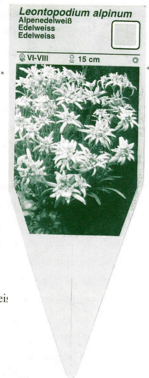
Steckschild für Balkonedelweiß

Exemplarische Inszenierungen der Alpenlandschaft sind an der zweiten Schweizerischen Landesausstellung in Genf 1896 zu verzeichnen. Das Ausstellungsgelände, an beiden Ufern der Arve und in der Plaine de Plainpalais, waren im landschaftlichen Stil gestaltet, mit Schlängelwegen und farbenprächtigen Beeten. Besonders in zwei repräsentativen Aussenräumen trat die Idee des Landschaftsgartens in Verbindung mit der Architektur als pittoreske Landschafts-Erscheinung. Einmal im Alpengarten vor dem Pavillon des Schweizerischen Alpenklubs und ein andermal im Village