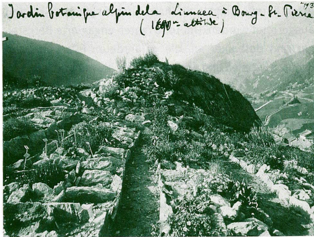
Alpengarten La Linnea auf dem grossen St. Bernhard