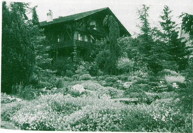
Floraire, Jardin d'Acclimatation, Chêne-Bourg, Genf H. Correvon, Foto aus den 1930er Jahren