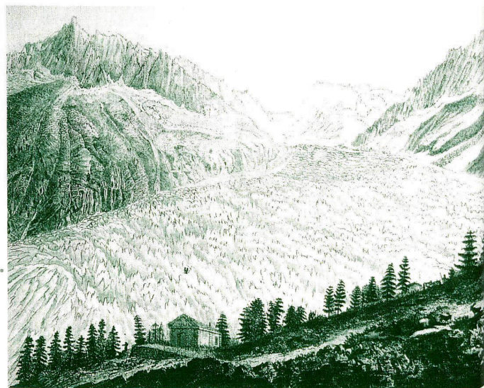
Fig. 3: «Vue de la vallée de Glace de Chamounix depuis le Montenvers», gravure coloriée.

Afin de faire profiter les jardiniers de son expérience, Miller publia en 1724 un dictionnaire: The gardeners and florists dictionary, or a complete system of horticulture en deux volumes, puis en 1731, The Gardeners Dictionary; containing the methods of cultivating and improving the kitchen, fruit and flower garden . Dans la septième édition du dictionnaire, datant de 1756-1759, l'auteur adoptait pour la première fois la classification linéenne. Il avait jusque là suivi la classification et la nomenclature des genres de Pitton de Tournefort utilisées dans son Institutiones Rei Herbariae (1700). Finalement il se résigna, alors que la classification de Linné était presque unanimement admise, en émettant toutefois quelques réserves quant à la définition des genres. Une huitième édition parut en 1768. Après la mort de l'auteur le Dictionary fut encore publié de 1795 à 1807. Il avait été traduit en Hollandais dès 1745, en 1750-1758 en allemand, et seulement en 1776 en français 20 . Les deux dictionnaires sont les ouvrages principaux de Miller, mais il en publia bien d'autres, ainsi celui des listes de plantes médicinales cultivées à Chelsea, le Catalogus Plantarum Officinalium suae in Horto Botanico chelseano , ainsi