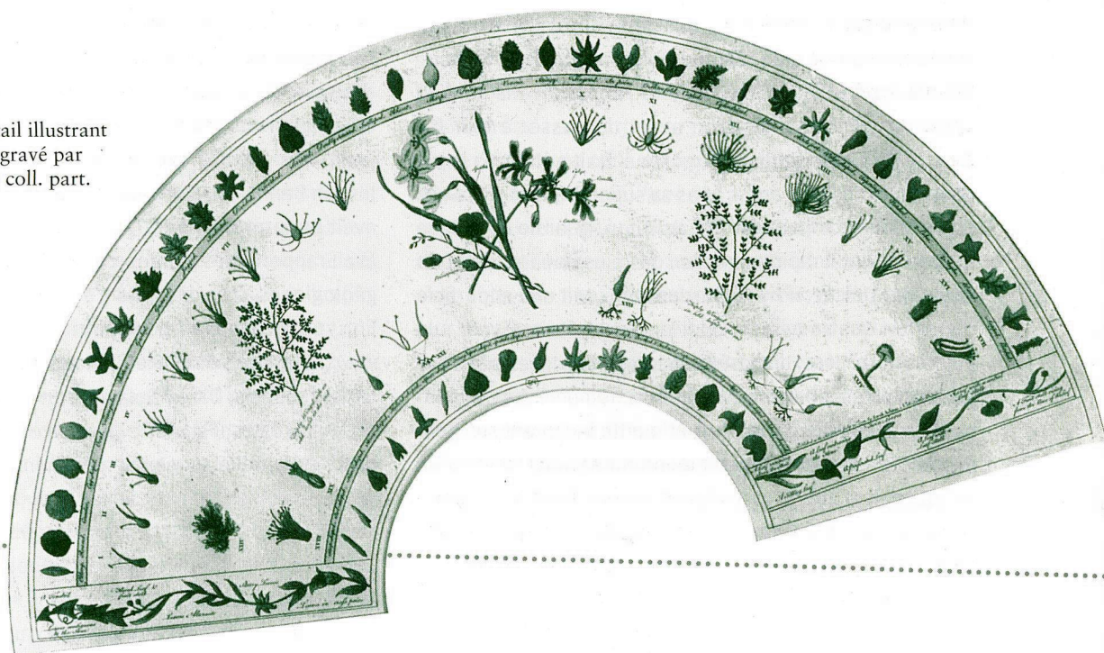
Fig. 1: Décor d'éventail illustrant le système de Linné, gravé par Sarah Ashton, 1772, coll. part.

L'importance du système linnéen apparut bientôt aux yeux de tous – au point qu'il devint même décor d'éventail (Fig. 1) –, mais il faut remarquer que son auteur excluait toute pensée de type évolutionniste, pensée qui pourtant existait à l'époque, avant même que Lamarck n'établît la théorie fondamentale de la transformation des espèces dans les années 1797-1800. Mais comme Cuvier s'y montra farouchement opposé, cent ans exactement s'écoulèrent entre l'établissement de la nomenclature linnéenne en 1758, et l'exposé de Darwin sur la théorie de l'évolution en 1858.