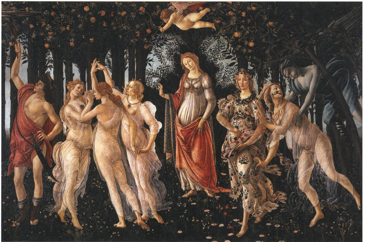
Abb. 1: Sandro Botticelli, Primavera, späte 1470er Jahre, Tempera auf Holz, Uffizien, Florenz.

sen des Vesuv die Stadt Pompej unter sich. Als im 18. Jahrhundert die moderne Archäologie mit ersten systematischen Grabungen begann, trat diese antike Flora erneut ins Bewusstsein und inspirierte fortan die Kunstwelt.