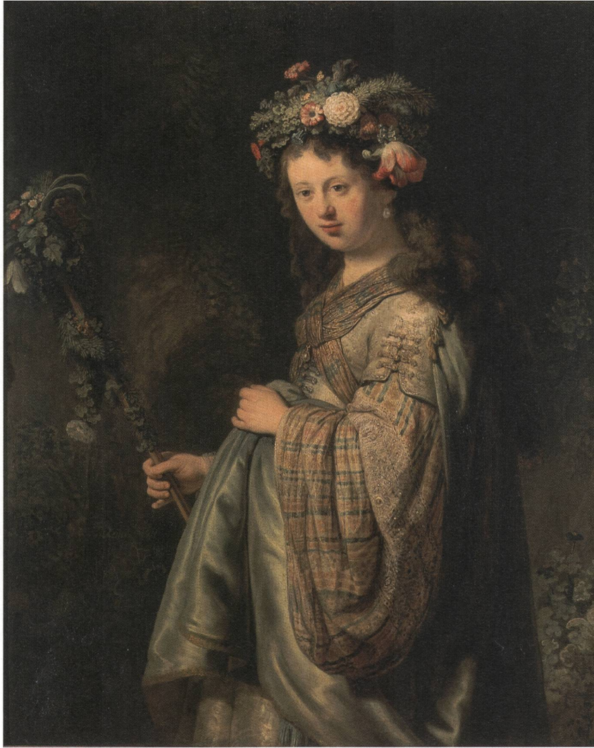
Abb. 2: Rembrandt van Rhijn, Flora (Saskia als Flora), 1634, Öl auf Leinwand, Hermitage Petersburg.

Stab bewaffnete Merkur, der Schutzherr von Haus und Hof, versucht gleichzeitig dunkle Wolken von der Szenerie fernzuhalten. Das Bild, das sicherlich zu den bekanntesten Werken der abendländischen Kunst gehört, spiegelt mit seiner komplexen Allegorik und insbesondere mit der Figur der Flora die Naturauffassung der Renaissance, in welcher der Mensch aktiv die Natur vervollständigt.