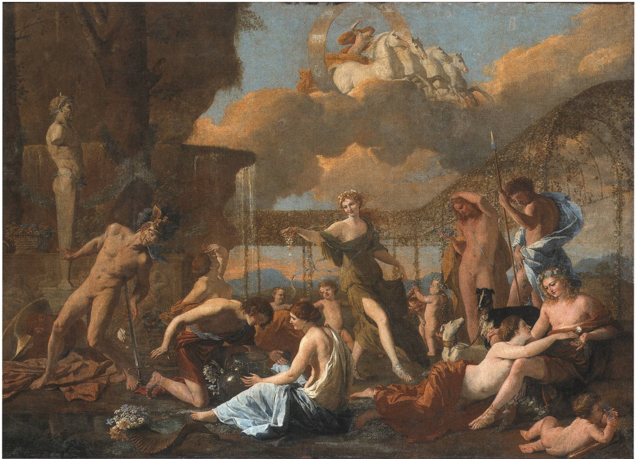
Abb. 3: Nicolas Poussin, L'Empire de Flore, 1631, Öl auf Leinwand, Gemäldegalerie alte Meister, Dresden.

Pieter van Avont und Jan Brueghel der Ältere malten 1692 eine «Flora im Garten», das heute im Kunsthistorischen Museum in Wien zu bewundern ist. Die junge Flora, unter Bäumen sitzend, bildet das Zentrum des Bildes. Eine Schar Putten umgibt sie und trägt ihr fleissig Blumen zu. Die idyllische Szenerie spielt sich vor einem prächtigen Schlossgarten ab, dessen strenge Geometrie damit kontrastiert. Die rechteckigen Beete, geschnittene Hecken, Treillagen und Gartenmauern bilden den ruhigen Hintergrund für die ausladenden und mit Früchten behangenen Bäume, unter denen Flora sitzt. Zu ihren Füßen wachsen Blumen wie Tulpen, Lilien, Malven und Kaiserkron, Pfauen Fasane und ein Papageienpaar bevölkern neben den eifrigen Putten das Bild.