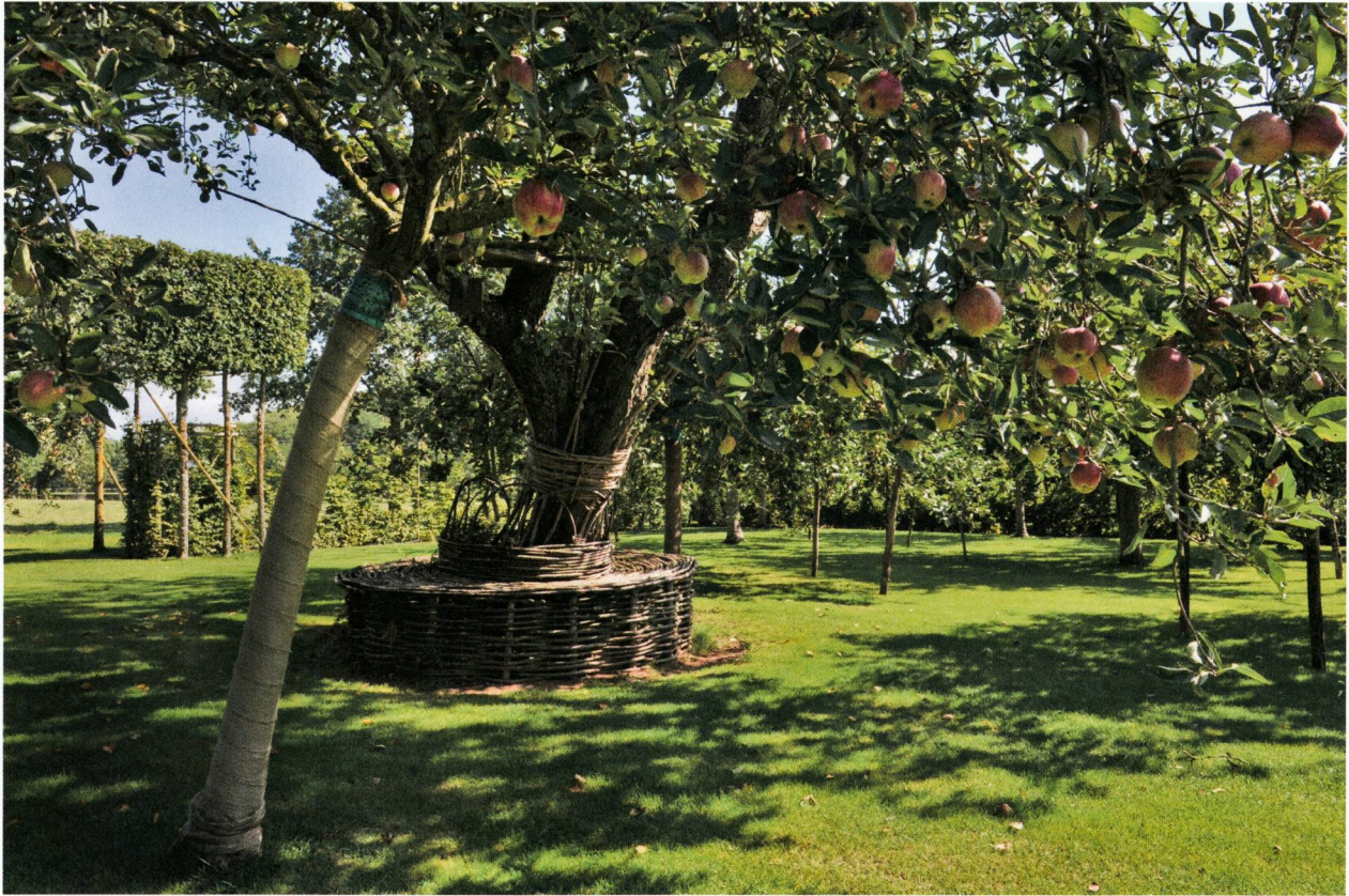
Abb. 2: Im Mittelalter befanden sich Obstgarten und Friedhof am selben Ort.