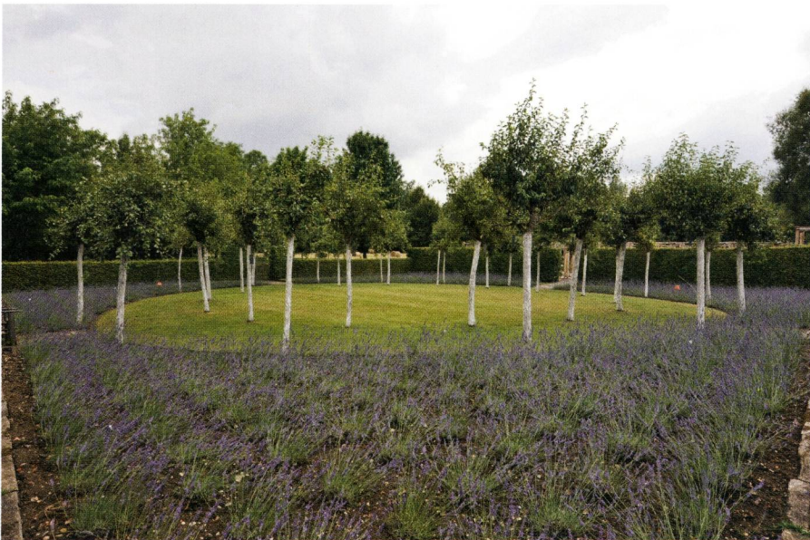
Abb. 3: Umgeben von Lavendel stehen im «Clos des trois Vergers» drei grosse Kreise Birn-, Vogelbeer- und Kirschbäume.