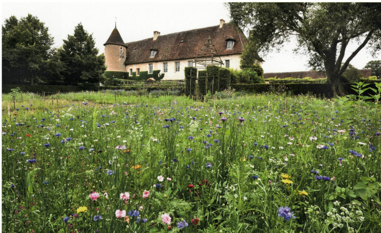
Abb. 4: Eine Buntbrache ersetzt heute den alten Küchengarten.