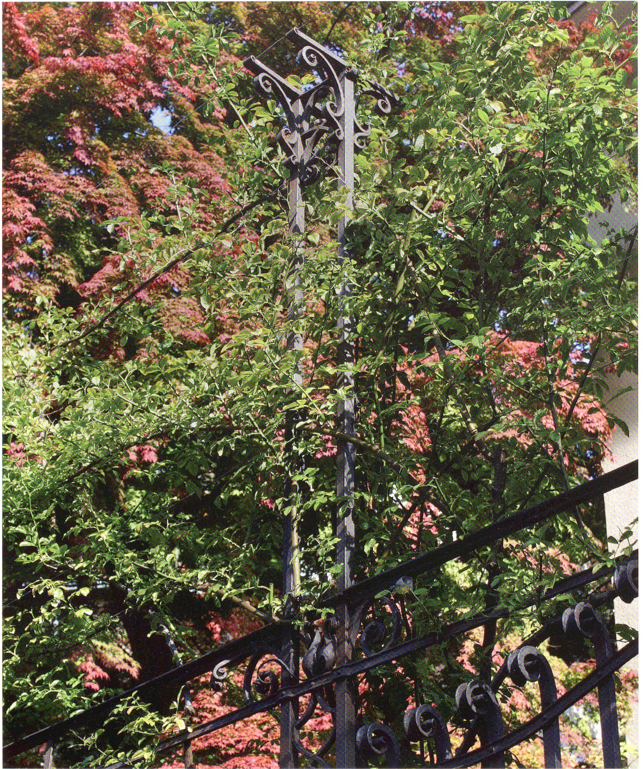
Abb. 5: Rankgerüst für Rosen, das oben das Spannen von fünf Drähten erlaubt.