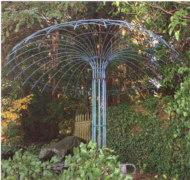
Abb. 3: Ein hellblau gestrichener Pflanzenschirm, der vielleicht einst mit Blüten von hellblauen Clematis bedeckt war, steht heute vergessen und inmitten von Unrat in einem Zürcher Garten.