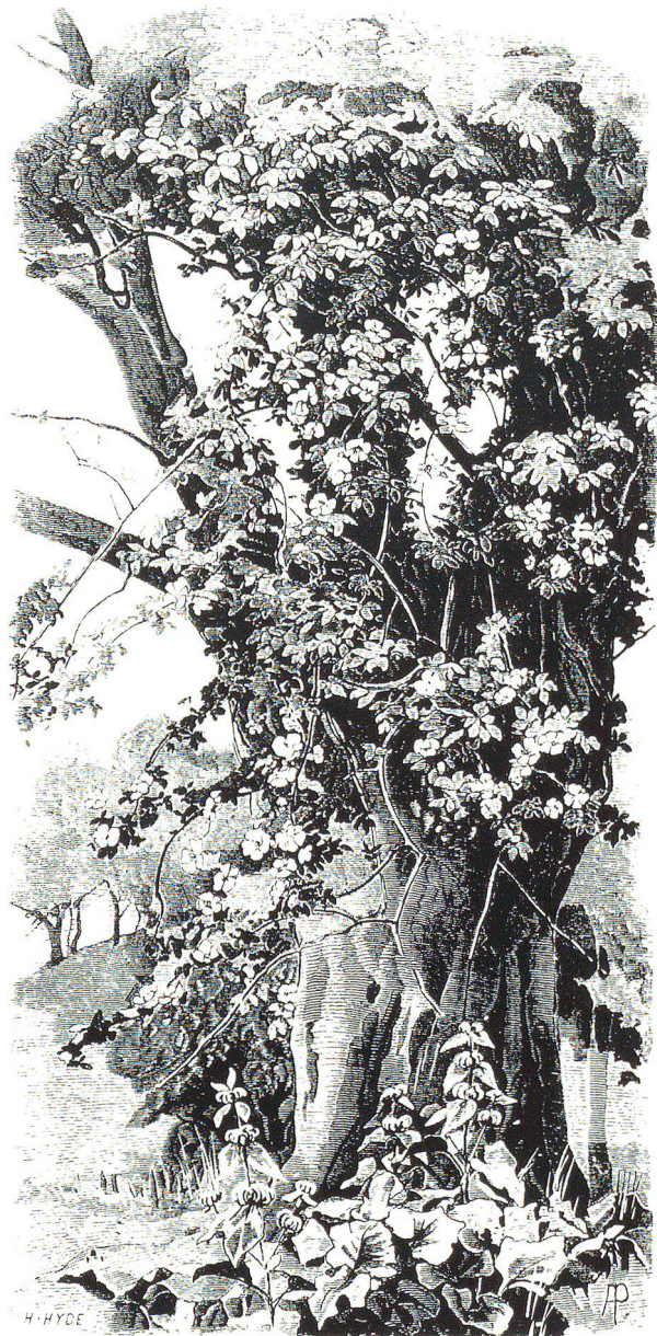
Abb. 4: «Wilde» Rose an einer Esche in einem englischen Park. Der bekannte Gartenfachmann William Robinson propagierte den «Naturgartenstil» mit solchen Abbildungen.

ten von dichtbelaubten Gewächsen können sie rasch schadhaft werden. Auch die mangelnde Kenntnis der ursprünglichen Funktion der verspielteren Stützen hat dazu geführt, dass sie in manchem Garten als unnützes Zeug in irgendeine Ecke verbannt und dann eines Tages endgültig weggeräumt wurden. So steht der – vielleicht –