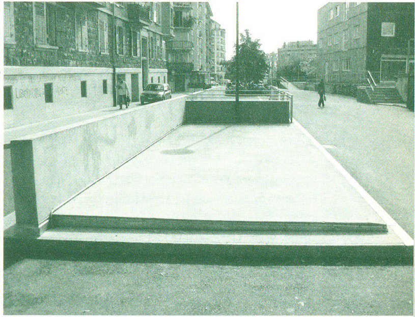
Abb. 1: Vorher: Platz auf dem Dach des Parkhauses an der Avenue des Tilleuls

Zu den erwünschten Auswirkungen der Aufwertung städtischer Zentren gehört es, dass die Stadtflucht eingedämmt wird, was sich in der gesamten Raumentwicklung positiv niederschlägt. Als erfreulicher Nebeneffekt eines Gartens im urbanen Kontext ist natürlich auch die Steigerung des individuellen psychischen wie auch physischen Wohlbefindens zu verzeichnen. Selbstverständlich bedeutet ein Quartiergarten nicht die Lösung aller Probleme. Er ist lediglich eines von vielen Stadtentwicklungsprojekten, die die Richtung einer nachhaltigen Entwicklung einschlagen. Ohne andere Massnahmen jedoch, sowohl auf der Ebene der