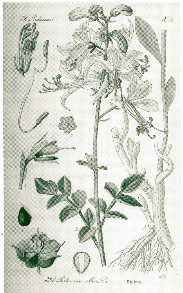
Abb. 4 Tafel aus Otto Wilhelm Thomé, Flora von Deutschland, Österreich und der Schweiz in Wort und Bild, Berlin-Lichterfelde, 1885, Bd. III.