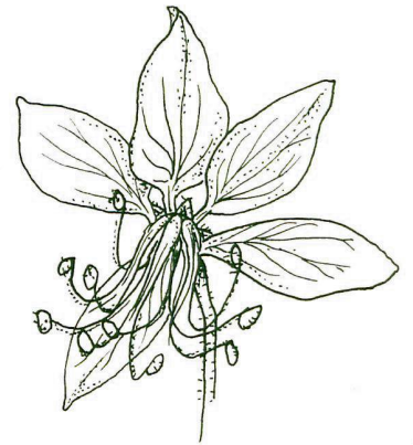
Abb. 1 Einzelblüte

In der Flora Helvetica (Wagner & Landolt, 1996) sind Diptam und Weinraute jedoch die einzigen Vertreter der Familie, zudem werden beide Arten als selten eingestuft – es muss sich dabei doch eher um besondere Arten handeln.... Die Gattung Dictamnus ist monotypisch; es gibt also nur eine einzige Art, Dictamnus albus L.; diese ist jedoch sehr vielgestaltig.