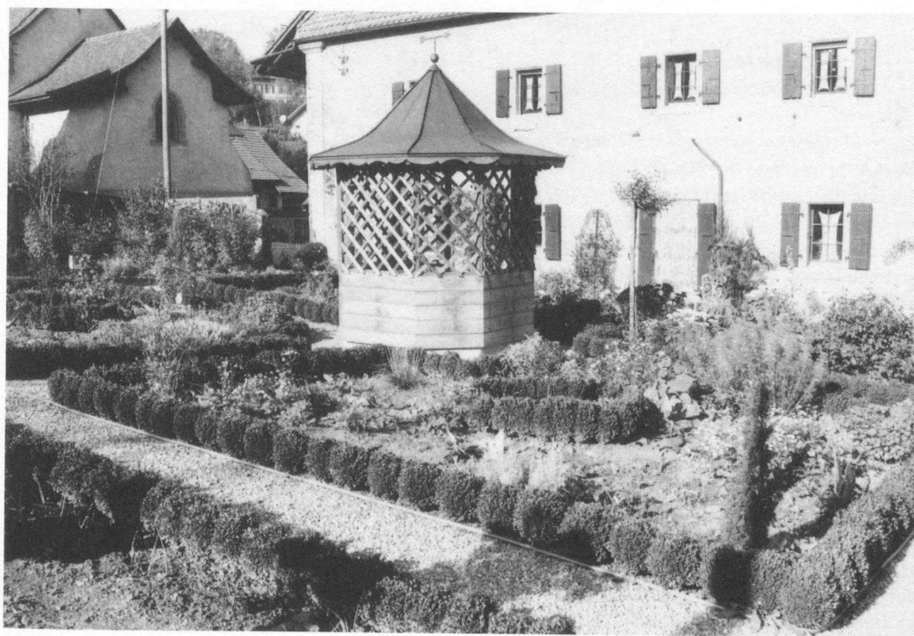
Vue du jardin

La photo, prise en octobre, ne restitue pas la richesse et la variété des plantations.