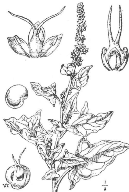
998. Chen. Bonus-Henricus L. Italia — 4-7.

Abbildungen aus «Flora Italiana Illustrata» Adriano Fiori und Giulio Paoletti, 1986.