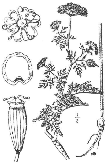
2372. Chær. bulbosum L. Istr., Triest., Piem. — 4.