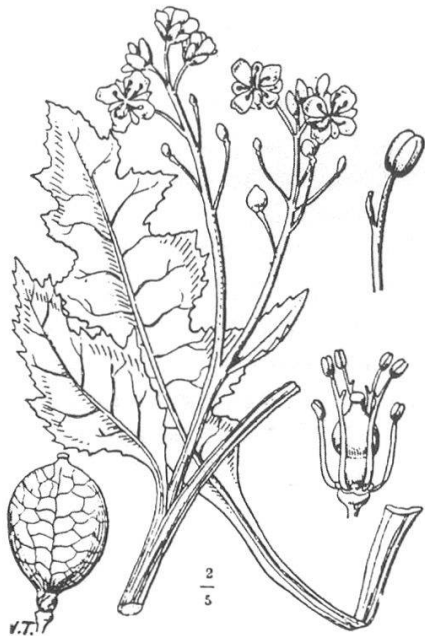
1410. Crambe maritima L. Lig., Nizz. — 2, avv. (Eur.).