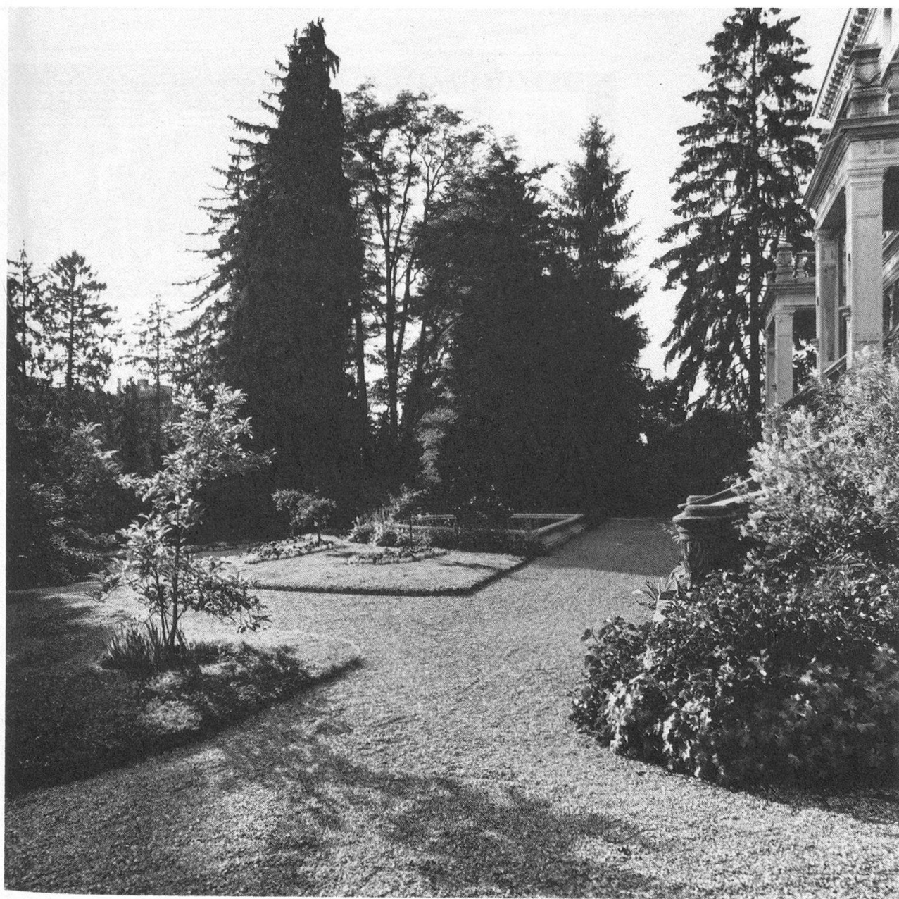
Villanaher Bereich des Patumbah-Parkes. 1986 – 92 vom Gartenbauamt Zürich saniert.