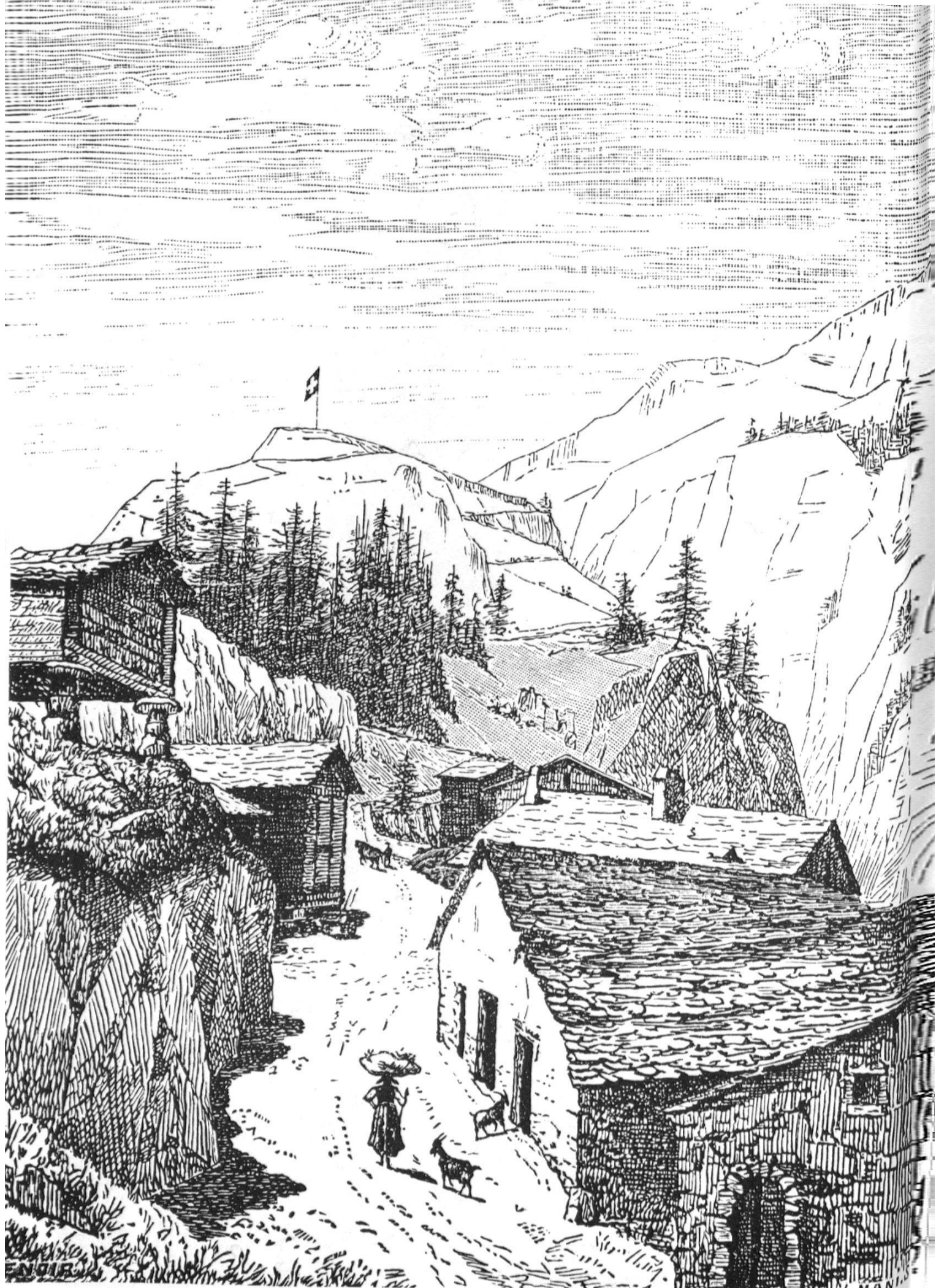
Der alpine botanische Garten der Linnaea in Bourg-Saint-Pierre. 222