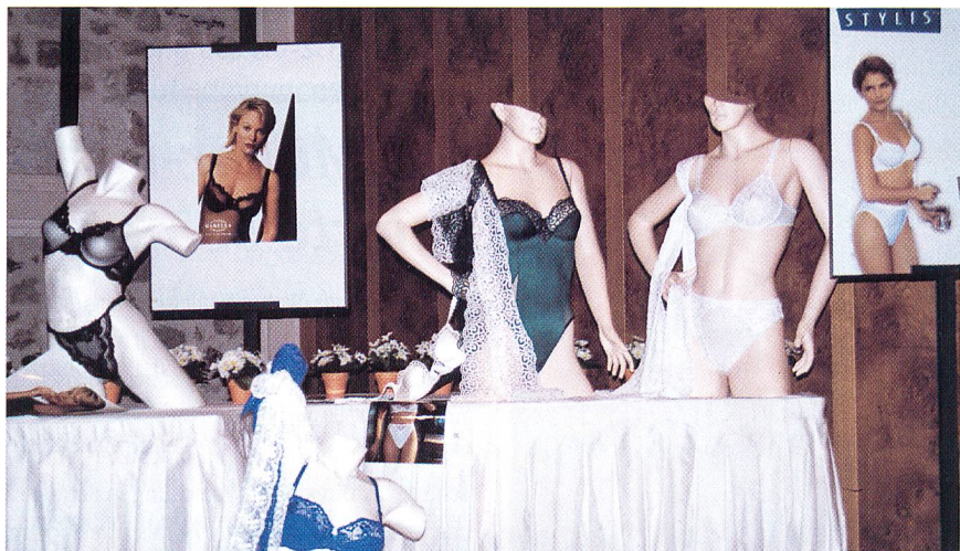
Aussteller: Rau & Co. AG - Stickerei mit Produkten der Habella AG, Frauenfeld, Jana dessous, Zürich, Lenzinger GmbH, Hinwil, Intertex, Steinbausem, Triumph International Zurzach

Bezüglich des Passiven Veredlungsverkehrs (PVV) steht jedoch so viel auf dem Spiel, dass die Problemlösung nicht den politischen Unabwägbarkeiten eines allfälligen EU-Beitritts in einer fernerer Zukunft überlassen werden kann. Der TVS befürwortet daher eine strategische Vereinbarung mit der EU, wonach sich die EU und die EFTA verpflichten würden, in ihre jeweiligen Freihandelsverträge von Anfang an eine Verbindungsklausel mit der EFTA bzw. der EU einzubauen. Sobald die EU und die EFTA mit dem gleichen Land ein Freihandelsabkommen hat, würde die Verbindungsklausel in Kraft treten, der freie Warenverkehr EU–EFTA–Drittland wäre gewährleistet und die grossen Vorteile des Freihandels mit der EU wären wieder intakt. Der Freihandel mit der EU wäre wieder ohne Tücken. Ein handelspolitisches Ziel, für das sich der Einsatz, der Kampf lohnt.