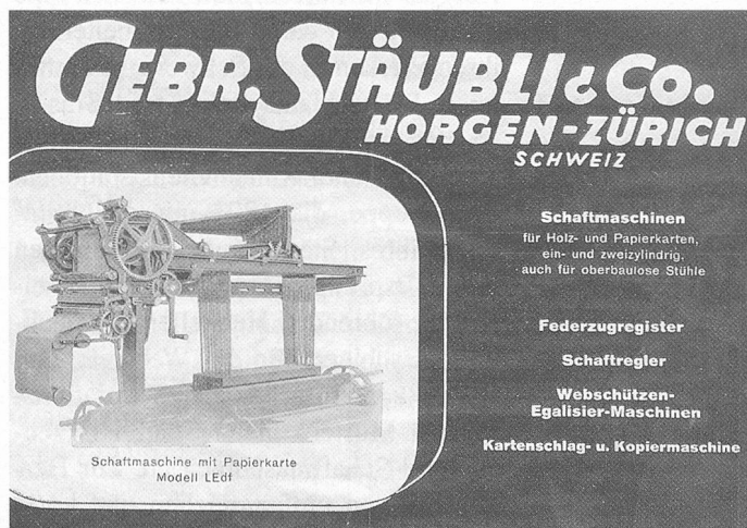
Inserat der Firma Stäubli aus den Mitteilungen über Textilindustrie, No. 11, November 1942.

Um den sehr arbeits- und dadurch kostenintensiven Materialfluss sowie das