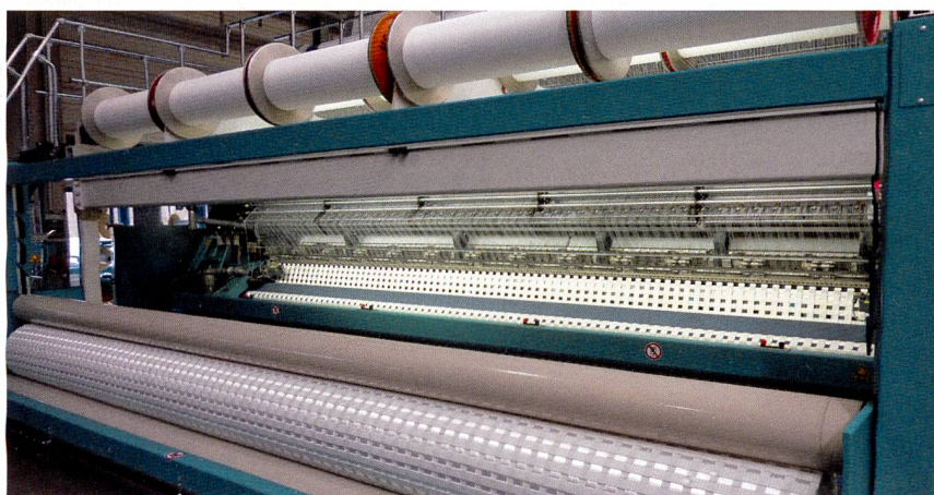
Abb. 1: Die RS MSUS-V bei der Produktion der starken Geogitter

Geotextilien sind flächenhafte und durchlässige Textilien. Sie dienen als Baustoff im Bereich des Tief-, Wasser- und Verkehrswegebau und sind für geotechnische Sicherungsarbeiten ein wichtiges Hilfsmittel. Geotextilien bestehen entweder aus natürlichen Rohstoffen oder Chemiefasern und werden zum Trennen, Dränen (Drainage), Filtern, Bewehren, Schützen, Verpacken und als Erosionsschutz eingesetzt. Geotextilien kommen in Form von Geweben, Gewirken, Vliesstoffen und Verbundstoffen zum Einsatz. Gewirkte Geogitter mit einer bisher unerreichten Zugfestigkeit sind beispielsweise für den Einsatz im Bergbau geeignet.