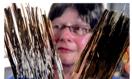
Abb. 3: Beim Vliesstoff-Hersteller Norafin in Mildenau laufen erste Versuche mit Basaltfasern