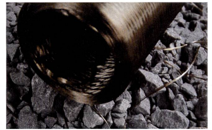
Abb. 2: Roving aus Basalt