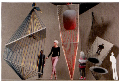
Abb. 1: Ruckstuhl by atelier oi