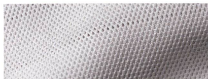
Abb. 1: Zweiseiten-Musterung aus einer Filetstruktur

Wird die komplette Range der verfügbaren Legebarren genutzt, sind insbesondere durch den Einsatz farbiger Garne vollkommen neue Optiken möglich. Die kolorierten Fäden lassen sich gegen-