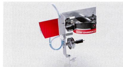
Abb. 2: USTER® CLASSIMAT 5 Messkopf am Befestigungsmodul

Neben der gesamten Palette an Qualitätsmessdaten, die der USTER® CLASSIMAT 5 bestimmen kann, steht nun ein zusätzliches Analysewerkzeug zur