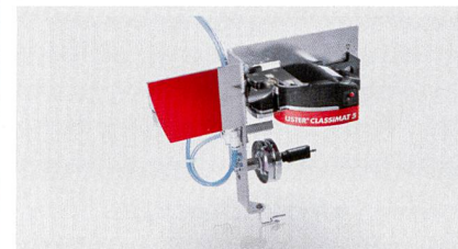
Abb. 2: USTER® CLASSIMAT 5 Messkopf am Befestigungsmodul

Neben der gesamten Palette an Qualitätsmessdaten, die der USTER® CLASSIMAT 5 bestimmen kann, steht nun ein zusätzliches Analysewerkzeug zur