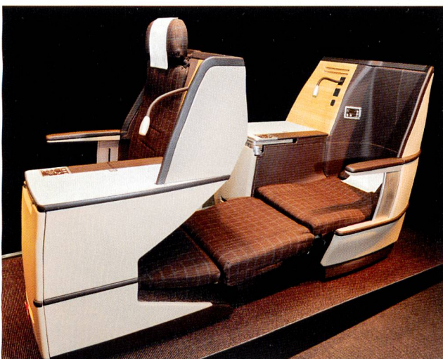
Abb. 3: Lantals pneumatische Komfortsysteme bei SWISS

Lantals pneumatische Komfortsysteme sind seit Frühling 2009 bei SWISS in den Business und First Class Sitzen integriert und funktionieren (Abb. 3). Die Rückmeldungen der Fluggäste sind überaus positiv, ermöglicht doch das innovative Sitzkissen ein unvergleichliches Komforterlebnis beim Sitzen wie beim Schlafen. Egal in welcher Sitzposition, Reisende können durch luftgefüllte Kammern den Härtegrad ihres Sitzes je nach persönlicher Vorliebe individuell anpassen. Business und First Class Fluggäste schätzen zudem den komfortablen Schlaf und die Erholung mit Massagefunktion und Lordosestütze. Damit erhöht sich die Kundenloyalität spürbar und führt zur besseren Auslastung der Flugzeuge in einem stark umkämpften Markt. Die deutliche Gewichtsersparnis mit dem Luftkissensystem reduziert die Betriebskosten und die CO 2 -Emissionen, ein weiterer Vorteil für die Fluggesellschaften.