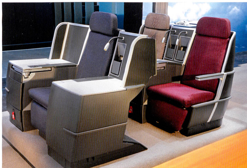
Abb. 1: Business-Class-Sitze von Thompson Aero Seating

Aktuelle Highlights bei den Sitzbezugsstoffen sind wunderschöne grossgemusterte Farb-