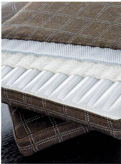
Abb. 2: Luftgefüllten Kissen bieten einen noch nie dagewesenen Sitz- und Schlafkomfort

verläufe und Relief-Effekte, kombiniert mit gleichmässigen Streifen, körnigen Texturen und Waffelmustern. Farblich dominieren feine Blautöne, elegantes Graphit-Grau und Erdfarben mit leuchtenden Akzenten. Für die Teppiche wurden Fischgrat- und Tweed-Klassiker neu interpretiert und mit Strukturen und neuen Mustern kombiniert. Passende Vorhänge und Leder runden mit ihren abgestimmten Designs und Farben die Kollektion ab.