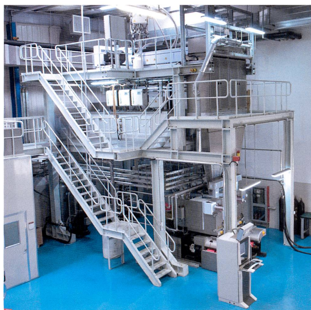
Abb. 4: BCF S3