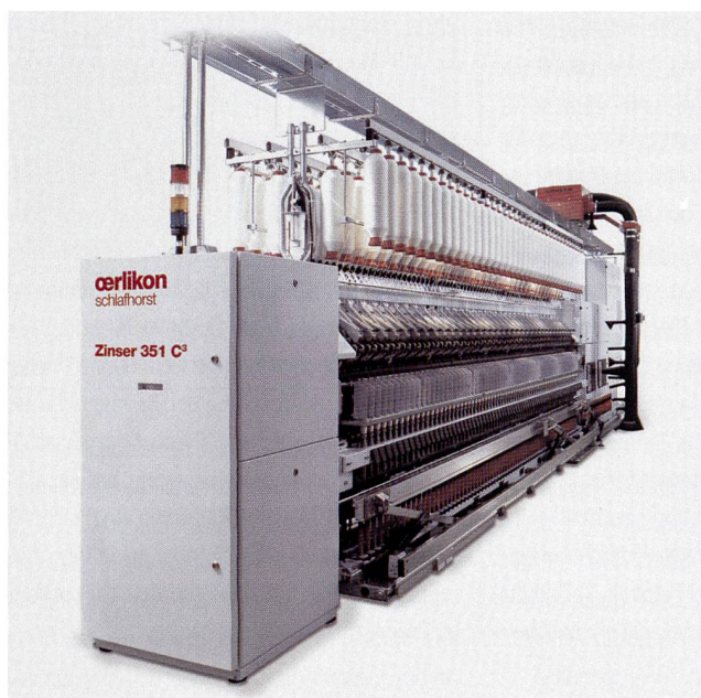
Abb. 3: Die Zinser-Ringspinnmaschinen 351 C³