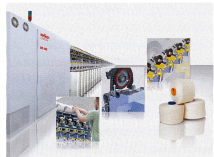
Abb. 2: BD 448 – die längste halbautomatische Rotorspinnmaschine

Der Marktführer für Filamentanlagen zeigte erstmals seinen zwölfköpfigen WINGS für Polyamid 6 und setzt damit neue Massstäbe in der Verarbeitung des anspruchsvollen Polymers zu guten Garnqualitäten. Um gegen die starke Konkurrenz aus China und Indien punkten zu können, setzen türkische Filamentgarnhersteller zunehmend auf qualitativ hochwertige Garne für den Teppich- und Automotive Bereich. Informationsschwerpunkt für den traditionell starken Texturiermarkt Türkei ist die ITMA-Neuheit und automatische Texturiermaschine eAFK sowie ihre manuelle Schwester eFK (Abb. 1). Ausserdem zeigte der Marktführer für Kunstrasenfilamentanlagen seine neuste Entwicklung für Sportrasen: MoisTurf bezeichnet die Ausrüstung zur Herstellung von hydrophilen Monofilamenten. Solche Garne werden als Kunstrasen vorzugsweise im Kontaktsport eingesetzt und sorgen dafür, dass sich Wasser auf der Garnoberfläche gleichmässig und nahezu natürlich verteilt.