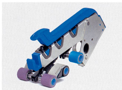
Abb. 5: Der Belastungsarm PK SE

Mit nahezu 70 Prozent Marktanteil ist das Unternehmen führender Anbieter hoch entwickelter BCF-Teppichgarnmaschinen. Der BCF-Bestseller 2011, die S+ mit drei Fäden pro Position, ist nun zu haben für das aufstrebende Teppichmaterial Polyester BCF, ein perfekter Ersatz für Polyester-Spinn garn aufgrund seiner Kosteneffizienz in der Produktion (Abb. 4). Produktionsanlagen für Polyester-Stapelfasern ermöglichen höchste Kapazitäten von bis zu 300 Tagestonnen und senken zugleich die Betriebskosten. Herstellern von Vliesstoffen wie etwa Geotextilien bieten sich kompakte Inline-Anlagen mit Kapazitäten bis zu 80 Tagestonnen an, die kleine Produktionsmengen erlauben und wenig Personal benötigen. Auf dem Menü stehen auch Maschinen oder schlüsselfertige Anlagen zur Herstellung von Nonwovens: von Spunbond und Meltblown bis zu Airlaid. Bei einem virtuellen Anlagenrundgang konnten sich Messebesucher zudem in 3D durch die Innovationen navigieren.