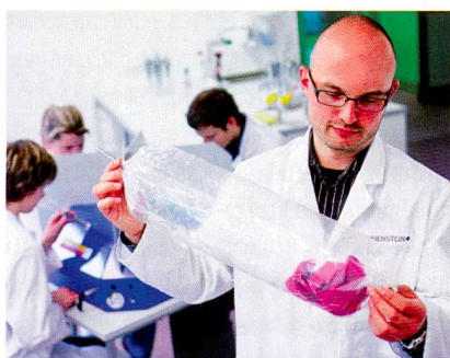
Abb. 5: Mit Hilfe zweier neuer Testmethoden lässt sich die Anbindung von unangenehmem Schweißgeruch in Textilien objektiv bewerten