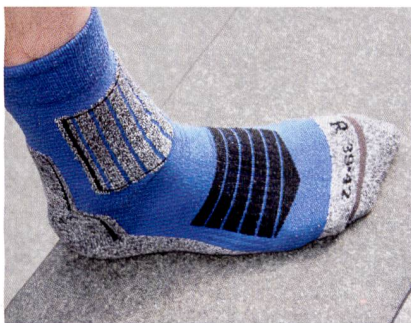
Abb. 6: Die Bindung und Freisetzung von Schweißgeruch an bzw. von Textilien kann zukünftig besser untersucht werden, um z. B. die Geruchsbindung von Sportsocken zu optimieren

Dass die Verhinderung von unangenehmem Schweißgeruch in Textilien und dessen Entfernung keine triviale Aufgabe ist, hängt in erster Linie mit dessen komplexer Zusammensetzung aus verschiedensten chemischen Substanzen zusammen. Verantwortlich für den typischen (unangenehmen) Schweißgeruch sind dabei u. a. spezifische Carbonsäuren. Bei ihren Untersuchungen «impfen» die Hohenstein Wissenschaftler die verschiedenen textilen Materialien mit einer definierten Menge von Carbonsäure, die zuvor radioaktiv markiert wurde. Um eine