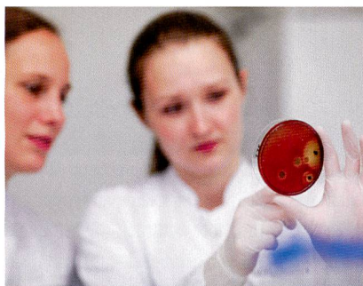
Abb. 1: Bakterien in textilen Fasern

Die Ergebnisse zeigen, dass die neuen, gezielt dotierten Faservarianten, unter Berücksichtigung bestimmter Voraussetzungen, für die Herstellung von Arbeitskleidung mit einem hohem Anteil an cellulosefasern möglich ist, was von den Trägern oft gewünscht wird. Bei der Variante mit Silbernitrat wurde zusätzlich Titanoxid zugege-