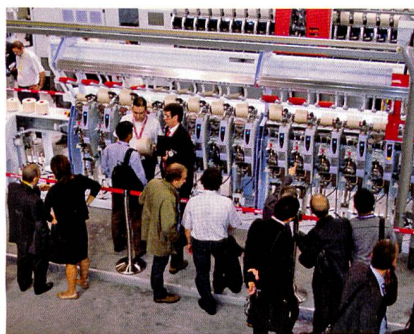
Abb. 2: Autoconer X5 mit zukunftsorientierter PreciFX-Technologie

bei den Produktionskosten, von der Spinnereien in aller Welt profitieren.