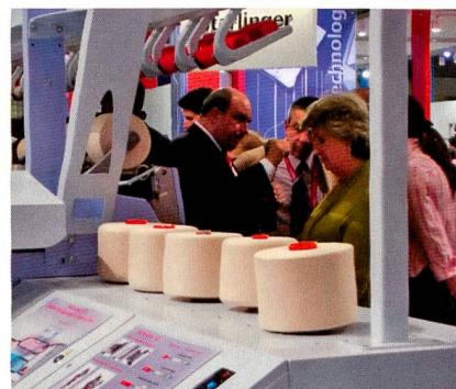
Abb. 3: Grosses Interesse der Besucherinnen und Besucher