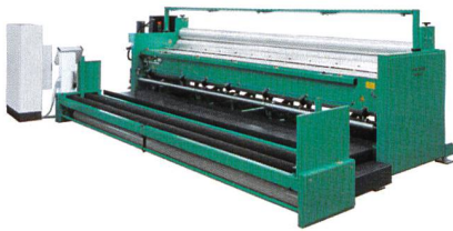
Abb. 1.: Gesamtansicht der Nähwirkmaschine MALIVLIES

die Montage und Inbetriebnahme sowie den Service und die Ersatzteilversorgung. Auch bei der Produktentwicklung wird das Unternehmen den Kunden zur Seite stehen. Damit ist der nahtlose Transfer der Malimo-Technologie gesichert.