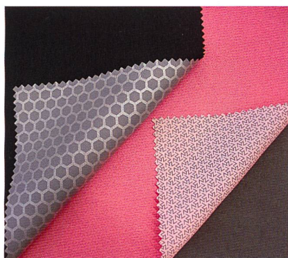
Abb. 4: Eschler-Skinliner

auch bei widrigen Wetterbedingungen trocken bleibt. Auf die feinen, weichen Oberstoffe werden elastische, wasser- und winddichte, wasserdampfdurchlässige PU-Membranen laminiert, die Eschler mit unterschiedlichen Strukturen anbietet. Ein spezieller Druck auf der Rückseite der Membran dient als Abstandhalter, sodass der Skinliner auch ohne Futterstoff direkt auf der Haut getragen werden kann (Abb. 4). Aus allen 2,5-Lagen Laminaten kann 100 % wasserdichte Bekleidung hergestellt werden, da die Nähte perfekt verschweißbar bzw. zusammenfügbar sind. Mit dem Skinliner bietet Eschler superleichte Lamine mit exzellenter Bewegungselastizität und hervorragendem Wetterschutz an, welche auch in Signalleuchtfarben, getestet nach dem Standard EN1150, erhältlich sind.