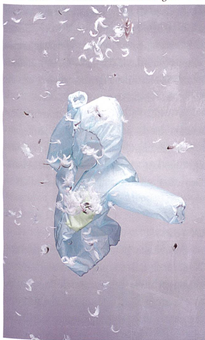
Abb. 3: USP – Ultralight Soft Protection

An das Kettenhemd eines Ritters erinnert das dank eines Silberfadens metallisch glänzende