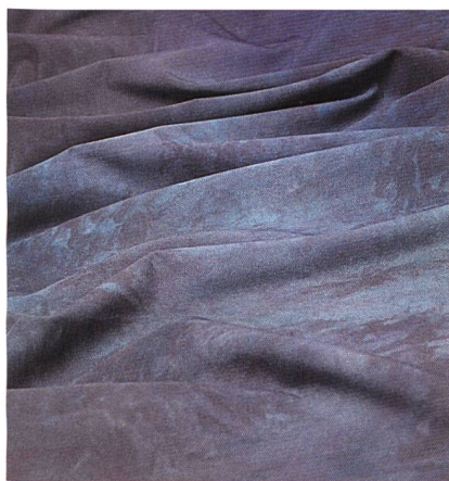
Abb. 2: One of a Kind

tupfer setzen mit Sicherheit auch die ultraleichten, transparenten sowie wasserabstossenden Ripstop-Regenjackenqualitäten – entweder Ton in Ton oder als spannende Bi-Colors.