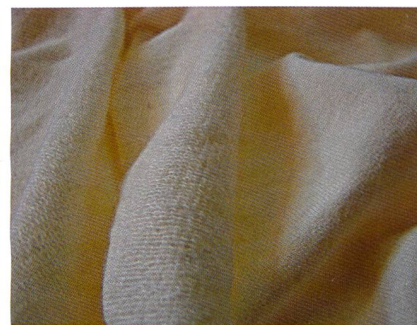
Abb. 2: Hyosung Vlies, 98 % Baumwolle / 4 % creora®

Der Schwerpunkt liegt in diesem Bereich auf leichten Stoffen mit technischen Eigenschaften, die die nötige Funktion bieten, sich aber dennoch für Street- und Casualwear eignen (Abb. 2).