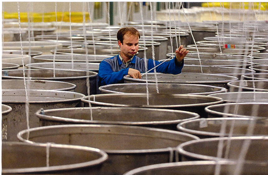
Abb. 1: Trevira Faserproduktion in Bobingen

Die biologisch abbaubaren (kompostierbaren) Fasern aus nachwachsenden Pflanzenrohstoffen