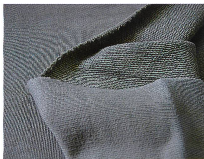
Abb. 1: SFT French Terry, 97 % Bio-Baumwolle / 3 % creora®

creora® eco H-550 garantiert ein perfektes Zusammenspiel nachhaltiger Biofasern wie Öko-Baumwolle, Wolle, Tencel® und Micro Modal® – für eine erstklassige Performance, die auf die Umwelt Rücksicht nimmt. Das Recycling-Nylon MIPAN® regen™ und die Recycling-Polyesterfaser regen™ werden zu leichten, weichen Stoffen verarbeitet (Abb. 1).