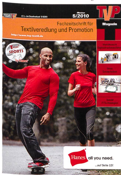
Abb. 2: Fachzeitschrift «TVP Textilveredlung & Promotion»

Das Buch «PUNCH» ergänzt das umfassende Verlagsprogramm der deutschen Verlagshaus Gru-