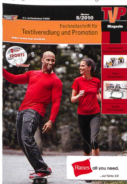
Abb. 2: Fachzeitschrift «TVP Textilveredlung & Promotion»

Das Buch «PUNCH» ergänzt das umfassende Verlagsprogramm der deutschen Verlagshaus Gru-