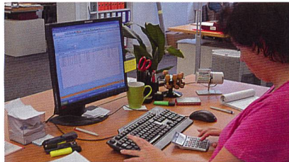
Das neue ERP-System «intex» – der Taschenrechner hat hoffentlich bald ausgedient

nachgelagerten Prozesse in der Produktion bestmöglich ablaufen und das Reporting lückenlos funktionieren kann, ist eine optimale Pflege der Stammdaten zwingend notwendig. «intex» er-