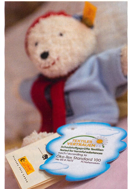
Abb. 3: OEKO-TEX® Standard 100 – Schadstoffprüfungen stehen bei Millionen textiler Produkte für humanökologische Sicherheit

steht, ist sicherlich in erster Linie darin begründet, dass das System von Anfang an international ausgerichtet war und eine grosse Transparenz für alle Beteiligten bietet (Abb. 3). Der Bekanntheits-