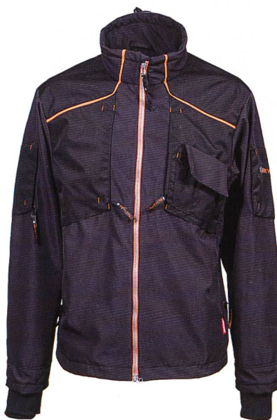
Abb. 3: Die Workwear Jacke von SKYLOTEC besitzt auffällige orange Reflektaspeln für eine optimale Sichtbarkeit

Wind, Regen, Kälte – wer kennt das nicht! Gerade bei Arbeiten im Freien wie beispielsweise auf Baustellen oder Windanlagen kann schlechtes Wetter