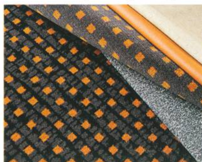
Abb. 1: Die neue Essentials Linie