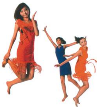
Abb. 2: Kollektion von KARL MAYER als Leistungsschau der DJ 4/2 EL

Komplettiert wird die Modellvielfalt durch das blaue Stretchkleid mit einer Musterung aus Orient-Ornamentals, das zum Outfit des Personals auf dem KARL MAYER-Stand zur ITMA ASIA+CITME 2010 gehörte.