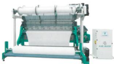
Abb. 1: Die erste Raschelmaschine mit CFK-Ausstattung, die RSE 4-1

Dem Trend nach feinen Spitzenqualitäten folgend, präsentierte KARL MAYER zur ITMA ASIA+CITME eine JL 59/1B in E 28 (Abb. 3). Die