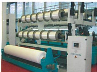
Abb. 5: Die neue Highspeed-Maschine RD 6/1-12

3D-Gewirke mit niedrigem Abstand gehören zu den Bestsellern unter den Spacertextilien, und entsprechend umkämpft sind ihre Märkte. Um seinen Kunden hier weitere Vorteile zu verschaffen, hat KARL MAYER mit der RD 6/1-12 (Abb. 5) eine neue Maschine mit einem äusserst