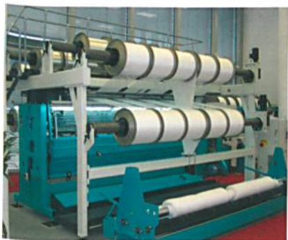
Abb. 4: Die neue HD 6/20-35, das Basic-Pendant zur HighDistance® zur Hausausstellung der KARL MAYER (China) Ltd. erstmals vorgestellt und überzeugte hier mit einem marktkonformen Leistungsprofil.

Als Fortsetzung der Zweiproduktlinienstrategie im Bereich der Doppelraschelmaschinen hat KARL MAYER eine Ergänzung im Basicformat zur HighDistance® entwickelt. Der Newcomer trägt die Bezeichnung HD 6/20-35 (Abb. 4). Er wurde