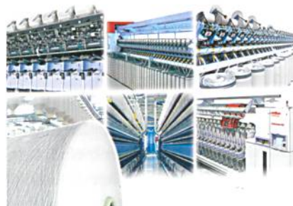
Abb. 4: Ringspinn-, Rotorspinn- und Spultechnologie von Oerlikon Schlafhorst

Dies bewies das grosse Interesse und der enorme Besucherandrang auf dem Oerlikon Schlafhorst