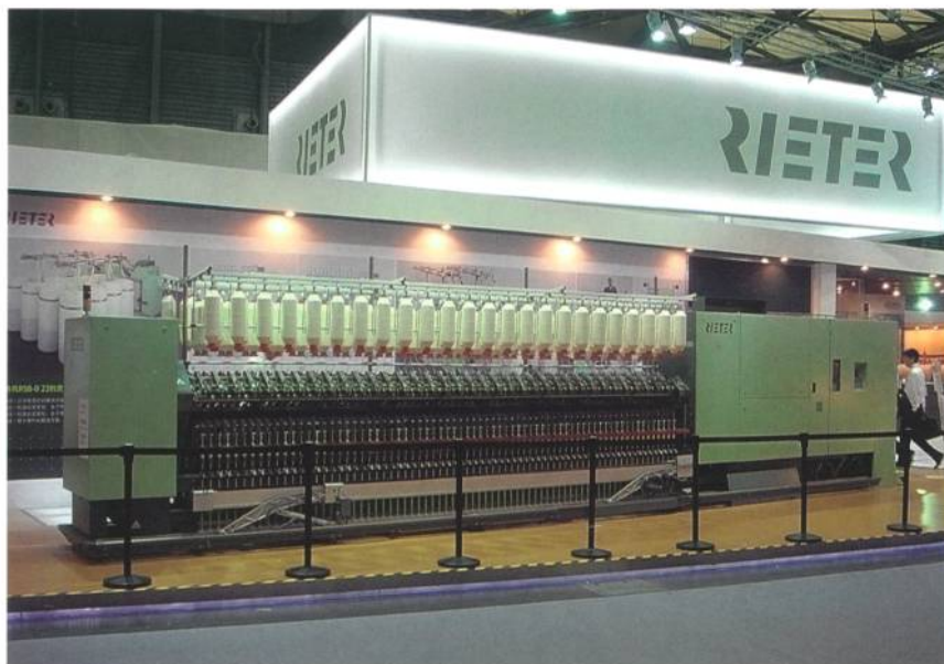
Abb. 1: Ringspinnmaschine G 32 von Rieter

Der Besuch der offiziellen chinesischen Delegation unter der Führung von Minister Du, der Besuch des Verwaltungsrates der Rieter Holding und des Schweizer Botschafters in China, Blaise Godet, freute Rieter ausserordentlich (Abb. 2). Rieter wendet hohe Beiträge für die Forschung und Entwicklung auf. Dies ermöglicht es, innovative Produkte herzustellen und diese den Bedürfnissen der Märkte anzupassen. Dieses Engagement gilt für China und auch für den Standort Schweiz, dessen Werte Rieter global vertritt. Sie spiegeln sich wider in