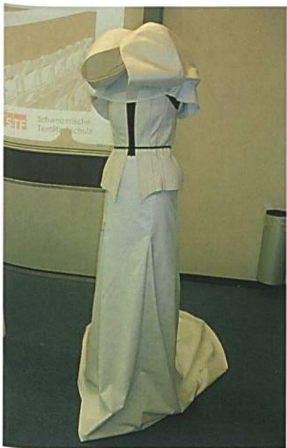
Eins von neun Modellen aus der «Ready-to-live»-Kollektion

Als Fokus des Projektes wurde das Thema «Bewegung» ausgewählt. Dieses Thema kann auf vielfältigste Weise interpretiert werden und ermöglicht eine spannende visuelle Umsetzung in der Fashion Show. Die technologische Basis für das Projekt sind die von der ETH entwickelten miniaturisierten Sensoren BodyANT, mit denen Körperbewegungen gemessen werden können.