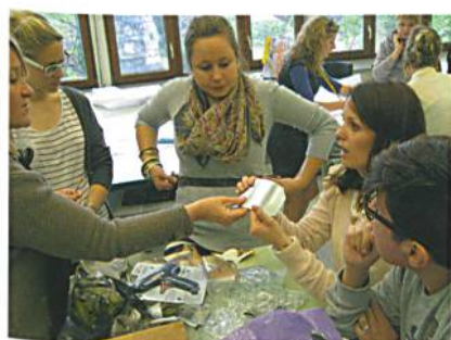
Auswahl der Materialien (gesponsert von Jakob Schlaepfer und Swisstulle AG)