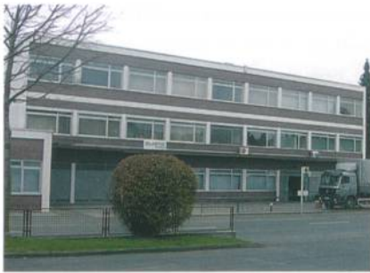
Abb. 3: Die Elastic Textile Europe GmbH

maschinen, Kettstühle, Raschelmashinen, Weftlocs, Rascheltronics und eine computer-gesteuerte Raschelspitzen-Anlage zum Einsatz. Damit ist Elastic in der Lage, sowohl grosse Output-Mengen auf gleich bleibend hohem Niveau zu gewährleisten, als auch sehr schnell und flexibel auf die speziellen Wünsche seiner Kunden einzugehen. In enger Zusammenarbeit realisierte Projekte, wie die erfolgreiche Markteinführung der aus Bio-Baumwolle mit einem 20-prozentigen Elastan-Anteil gefertigten Wäsche-Linie Pure Origin® von Triumph, verdeutlichen die individuell auf die Bedürfnisse der Abnehmer zugeschnittenen Services von Elastic. Gleichzeitig werden sowohl die produzierten Rohwaren als auch die fertig ausgerüsteten Gewirke einer umfangreichen Qualitätsprüfung unterzogen, bevor sie an die «Top-Player der internationalen Wäsche-, Sport- und Badeindustrie in Europa, Asien und Amerika» verschickt werden.