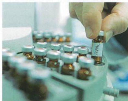
Abb. 4: Seit dem 1. Mai 2009 ist die Substanz Dimethylfumarat gesetzlich verboten

Seit dem 1. Mai 2009 ist die als Biozid eingesetzte Substanz Dimethylfumarat (CAS-NR. 624-49-7) EU-weit gesetzlich verboten (Abb. 4). Das Verbot bezieht sich auf alle Verbraucherprodukte, die einen Gehalt von mehr als 0,1 mg/kg aufweisen, und betrifft grundsätzlich alle Warengruppen – vor allem aber Schuhe, Möbel und andere Lederwaren. Beim Oeko-Tex® Standard 100 ist Dimethylfumarat als biozides