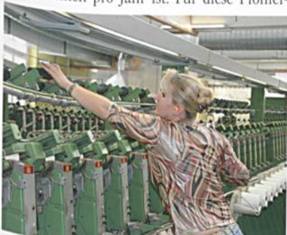
Abb. 2: Hemden- und Blusenhersteller eterna Mode verlässt sich auf Oeko-Tex® International