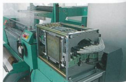
Abb. 2: Linearmotoren zur Steuerung der Legebarren