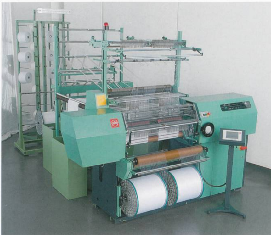
Abb. 1: Gesamtansicht der Kettenwirkmaschine mit Schusseintrag vom Typ MDC

Die elektronisch gesteuerten Schusslegebarren (Abb. 2) erlauben eine hohe Flexibilität bei der Musterung, schnelle Artikelwechsel sowie theoretisch «endlose» Rapportlängen. Ausserdem hat die Maschine dadurch weniger mechanische Teile und somit einen geringeren Verschleiss. Die Maschinengeschwindigkeit lässt sich individuell den von der Bindung geforderten Legungen anpassen, wodurch sich die Produkteigenschaften gezielt beeinflussen lassen.