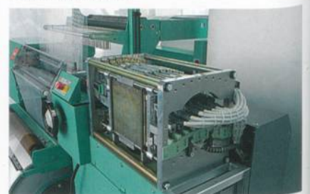
Abb. 2: Linearmotoren zur Steuerung der Legebarren