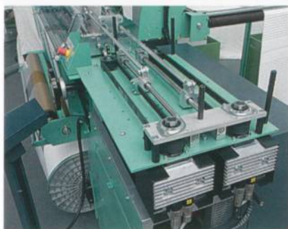
Abb. 4: Servomotorantrieb für Langschüsse von bis zu 450 mm

Die Maschinen MDC 8/630 und MDC 3/830 sind für die Produktion von elastischen und nicht-elastischen Bändern für Unterwäsche und Outdoor-Bekleidung, von medizinischen und orthopädischen Artikeln, von Flauschband für Klettverschlüsse, von elastischen und nicht-elastischen Netzen für Autoinnenräume sowie von Dekotextilien geeignet. Spezialitäten der MDC 3/830 sind Leibbinden und Nierengurte sowie Blutfilter.