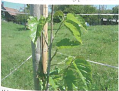
Abb. 4: Züchtung der Futterpflanze

kommen schaffen. «Wir Bauern müssen immer wieder innovativ sein, auch ausserhalb des traditionellen Berufsbildes, damit wir konkurrenzfähig bleiben», sagt Urs Bernhard, Landwirt in Worb. Bei ihm werden derzeit die ersten Seidenraupen mit den Blättern des weissen Maulbeerbaums ( morus alba ) aufgezogen (Abb. 3). Wenn diese sich wie geplant nach rund