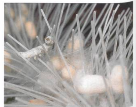
Abb. 2: Verpuppung

Die Seidenraupe (Abb. 1) ist die Larve des Seidenspinners. Die Seidenraupe häutet sich viermal, und sie ist 30 bis 35 Tage nach dem Ausschlüpfen aus dem Ei spinnreif. Die Spinnrüden der Raupe bestehen aus einem vielfach gewundenen Schlauch, dessen hinterer Teil das aus Proteinen bestehende Seidenmaterial absondert. Dieses wird durch dünne Ausführungsgänge zu der im Kopf gelegenen Spinnwarze und von dort aus dem Körper geleitet. Das aus der Spinnwarze austretende Protein-Material erhärtet sich an der Luft sofort zu einem Faden. Indem die Raupe beim Austreten des Materials gezielte Kopfbewegungen macht, legt sie um sich herum Fadenwindung um Fadenwindung. Nach dem anfänglichen Ausstoss einer unregelmässigen, lockeren Fasermasse, der so genannten Wattseide, ist sie in kurzer Zeit von einem dichten Seidengespinnst, dem Kokon, eingeschlossen (Abb. 2). Dieser Kokon besteht aus einem einzigen bis zu 900 m