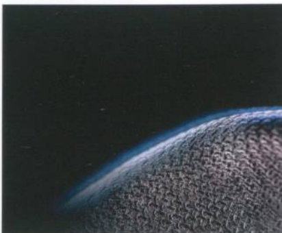
Abb. 1: Für ein Mehr an Sicherheit

schoeller®-works ist die neue Division von Schoeller Switzerland, deren Fokus sich auf die spezifischen Bedürfnisse des Bereichs Workwear richtet. Ein professionelles Team hat sich in einer der weltweit innovativsten Textilfirmen darauf spezialisiert, individuelle Lösungen mit einem Mehrwert an Sicherheit, Esprit und Service zu entwickeln. Das Resultat ist die spannende Produktlinie schoeller®-works, die eine optimale Kombination von hochfunktionellen Geweben und Textiltechnologien für Uniformen, modische Corporate Wear und Arbeitsschutzbekleidung bietet (Abb. 1). Aber