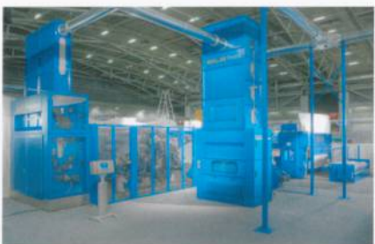
Abb. 3: Die kostengünstige Nadelvliesanlage AlphaLine

Ausserdem informierte Dilo über die AlphaLine. Diese kostengünstige Nadelvliesanlage wurde für mittlere Durchlaufgeschwindigkeiten bis ca. 80 m/min entwickelt. AlphaLine ist eine kompakte und ökonomische Lösung für universelle Vliesbildungs- und -verfestigungsaufgaben. Sie besteht aus den Komponenten AlphaFeed, AlphaCard, Dilo-Layer DLA und den Alpha-Nadelmaschinen.