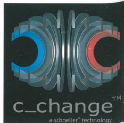
Abb. 2: Die bionische Klimamembrane c_change™

NanoSphere®, schoeller®-PCM™, cold-black® oder der bionischen Klimamembrane c_change™ (Abb. 2) veredelt, garantieren sie allesamt höchste Funktionalität, Strapazierfähigkeit, Langlebigkeit und Pflegeleichtigkeit.