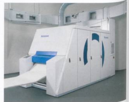
Abb. 2: TC-07H mit Schlaubeinheit TC-SU

Gleichzeitig haben Fleissner und Trützschler auch an einer Lösung für Kleinanlagen gearbeitet. Als Folge davon ist das neueste Mitglied der Fleissner-Wasserstrahlverfestigungsfamilie jetzt in zwei Standardgrößen erhältlich. In Kombination mit der neuen Trützschler-Karte TC-07-H (Abb. 2) mit Vliesabnehmer bietet es