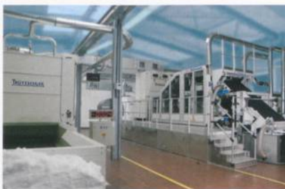
Abb. 1: Das neue Erko-Kardensystem im Fleissner-Technikum

Das erste Projekt innerhalb der Gruppe war die Entwicklung einer neuen Karte für die Anforderungen wasserstrahlverfestigter Produkte. Das Ziel war eine hohe Leistung von bis zu 400 kg/h/m mit einem guten Festigkeitsverhältnis in Längs- und Querrichtung (MD/CD) von 3:1 oder besser und einem Gewichtsreich von 20–100 g/m 2 , der sich gegen eine Dreifachabnehmerkrempel behaupten kann. Alle Ziele werden mit der neuen Wirrvlieskarte EWK413 erreicht.