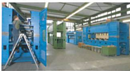
Abb. 6: Vernadelungsmaschinen

Das folgende Foto zeigt die Produktion auf einer 6,8 m breiten Nadelmaschine und drei Nadelmaschinen mit einer Breite von 3,8 m. Es sind sowohl Einfach- als auch Doppelnadelmaschinen dargestellt (Abb. 6).