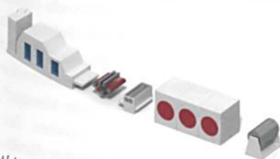
Abb. 5: Anlage für die chemische Verfestigung

Fleissner liefert seit vielen Jahrzehnten Komponenten für chemische Standardverfestigungsprozesse (ca. 80 m/min) wie etwa Schaumfoulard und Trockner. Daneben hat Fleissner vor kurzem das chemische Hochgeschwindigkeitsverfestigungsverfahren entwickelt (Abb. 5). Mit einer kleinen Wasserstrahl-