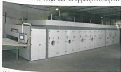
Abb. 4: Fleissner-Bandofen

Um auch komplette Nonwovenanlagen für die unterschiedlichsten Thermoverfestigungsanwendungen anbieten zu können, hat Fleissner einen neuen Bandofen entwickelt (Abb. 4). Dieser folgt der Gruppenphilosophie,