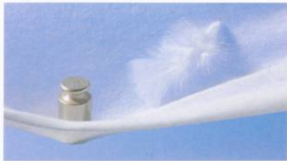
Abb. 2: Hyperlacing-Produkt

Nadelvliese aus feinen Fasern mit einem Flächengewicht von ca. 30 g/m 2 . Diese Produkte finden Verwendung in den Bereichen Medizin, Hygiene, Vlieskunstleder, Interlinings und als Filtermedien (Abb. 2).