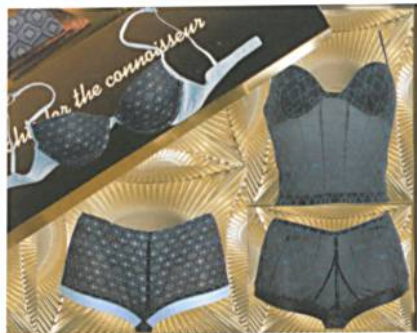
Abb. 3: Jacquarddesign einer RSJ 5/1 E

Hergestellt wurde die kleidsame Köstlichkeit im Maschenformat auf einer Hochleistungs-Jacquard-Raschmaschine vom Typ RSJ 5/1 EL, die ein bereits bewährtes Erfolgsrezept [1] umsetzt. Man nehme eine Prise