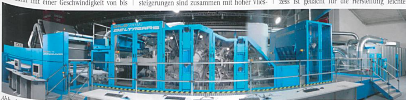
Abb. 1: Hyperlayer

Die Hyperneedling Technologie nutzt das neu entwickelte Cyclopunch Prinzip und ca. 20'000 Nadeln/m/Brett. Die Nadelkerbe ist an die Faserfeinheit angepasst, sodass nur eine einzige Faser erfasst wird. Die Nadel bewegt sich kreisförmig, wodurch eine Steigerung der Durchlaufgeschwindigkeit auf mehr als 100 m/min erreicht wird. Der Hyperlacing Prozess ist gedacht für die Herstellung leichter