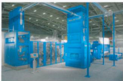
Abb. 3: Die kostengünstige Nadelvliesanlage AlphaLine

Ausserdem informierte Dilo über die AlphaLine. Diese kostengünstige Nadelvliesanlage wurde für mittlere Durchlaufgeschwindigkeiten bis ca. 80 m/min entwickelt. AlphaLine ist eine kompakte und ökonomische Lösung für universelle Vliesbildungs- und -verfestigungsaufgaben. Sie besteht aus den Komponenten AlphaFeed, AlphaCard, Dilo-Layer DLA und den Alpha-Nadelmaschinen.