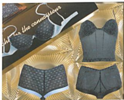
Abb. 3: Jacquarddesign einer RSJ 5/1 E

Hergestellt wurde die kleidsame Köstlichkeit im Maschenformat auf einer Hochleistungs-Jacquard-Raschelmachine vom Typ RSJ 5/1 EL, die ein bereits bewährtes Erfolgsrezept [1] umsetzt. Man nehme eine Prise