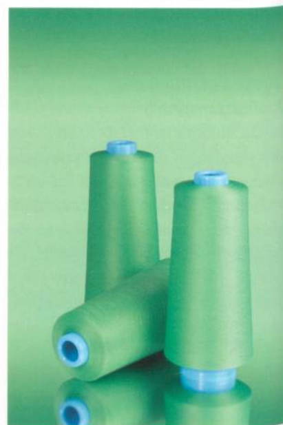
Abb. 2: P_Sabatex

lierten Produktlinien SabaC, Serafil und Rasant – für viele Anwendungen die Originale mit einem hohen Mass an Authentizität (Abb. 2). Für